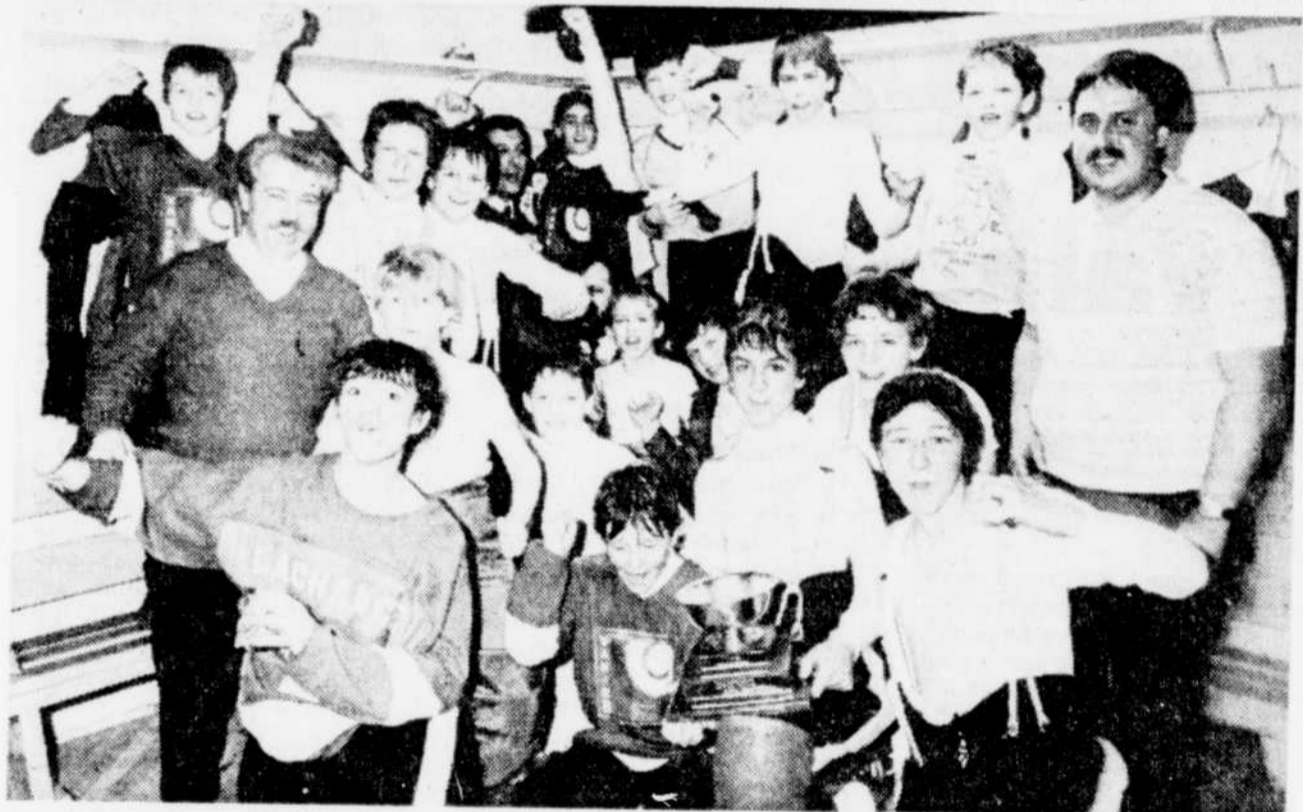
Une joyeuse bande, l'équipe de Vanier jubilant dans son vestiaire après avoir décroché le championnat "CC" au Tournoi international pee wee.