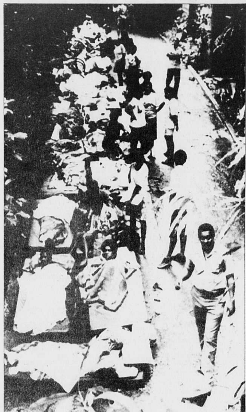
Les pluies torrentielles qui s'abattent sur Rio de Janeiro depuis vendredi ont nécessité l'évacuation de nombreux patients d'hôpitaux. Au moins 238 personnes ont été tuées et 10.000 autres sont sans-abris.