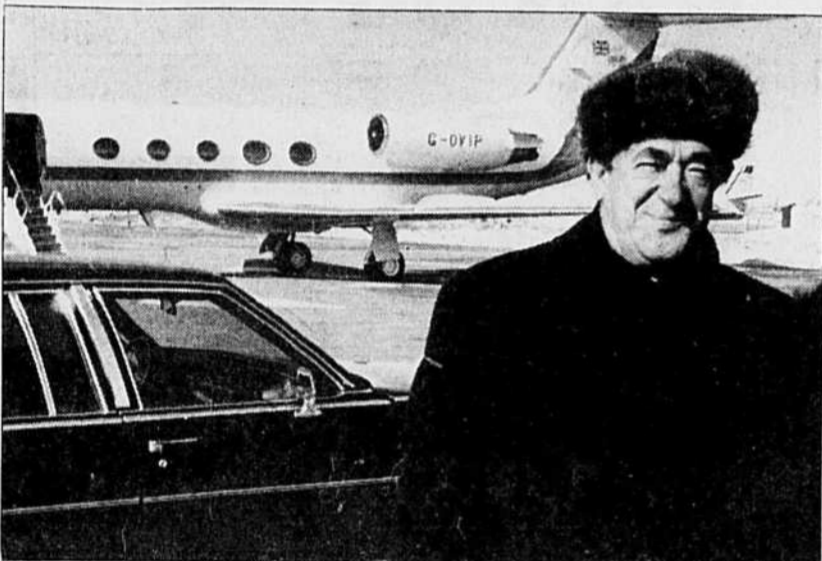
Robert Maxwell est arrivé à Dorval, hier, à bord de son jet privé, bien décidé à parler sérieusement affaires.