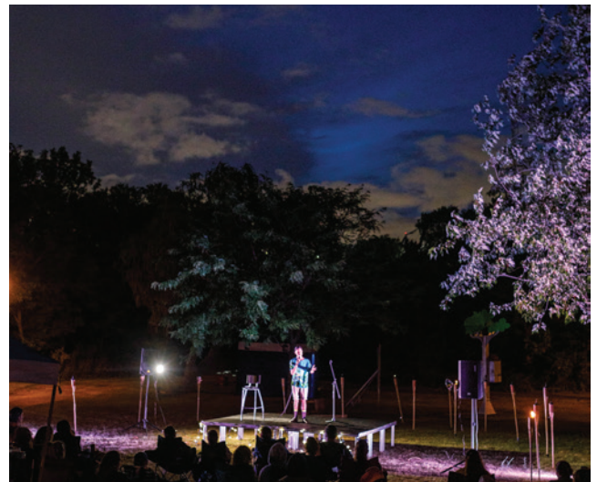
8 août | Humour aux flambeaux avec les finissants de l'École nationale de l'humour