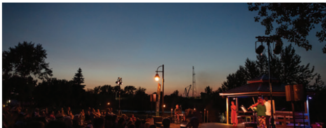
4 juillet | Inauguration du piano public avec Danielle Tremblay

Les spectateurs ont vécu toute une gamme d'émotions lors de ces rendez-vous estivaux mettant en scène des artistes passionnés de tous horizons. Des soirées conviviales et chaleureuses pour profiter pleinement de la belle saison.