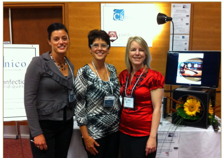
Congrès de l'Association des avocats et avocates de province, 23 septembre 2011.

C'est ainsi que lors du Congrès de l'Association des avocats et avocates de province ayant eu lieu à Boucherville du 22 au 25 septembre dernier, nous sommes ralliées pour vous représenter et discuter avec les avocats de votre travail. Un exemplaire du Journal des secrétaires juridiques a bien sûr été remis à chacun de nos visiteurs afin qu'il vous soit remis en mains propres. Nous continuerons de vous représenter lors de futurs événements, en rappelant à vos patrons que votre précieux apport mérite une attention particulière.