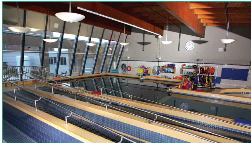
LE BASSIN THÉRAPEUTIQUE DU CENTRE OFFRE DES SERVICES DE POINTE EN RÉADAPTATION.

Le CRR La RessourSe offre de nombreux programmes et services de réadaptation et d'intégration en déficience motrice, en déficience visuelle, en