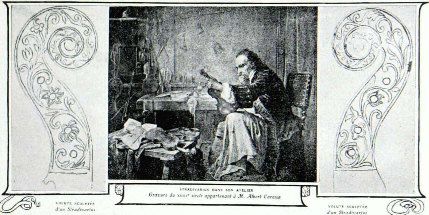
STRADIVARIUS DANS SON ATELIER Gravure du XVIII e siècle appartenant à M. Albert Carezza