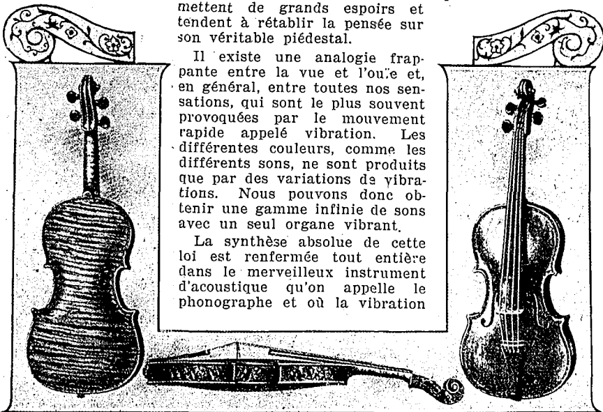
Stradivarius amatisé de 1677

Le marimba, de la côte occidentale d'Afrique, procède du même principe: il se compose d'un châssis de bois sur les bords duquel reposent des lames de même matière. Sous les lames sont suspendus des cales basses creuses dont la capa-