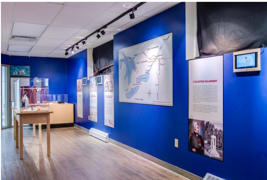
Exposition « 1813 : stratégie militaire à la Pointe-aux-Anglais (automne 2013)