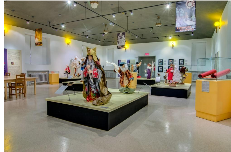
Exposition « Colle, Papier, Ciseaux » (automne 2013)