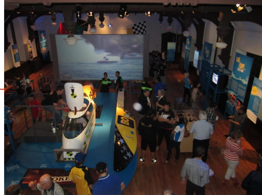
Exposition « Régate HYDROPLANE : la science derrière la machine » (été 2013)