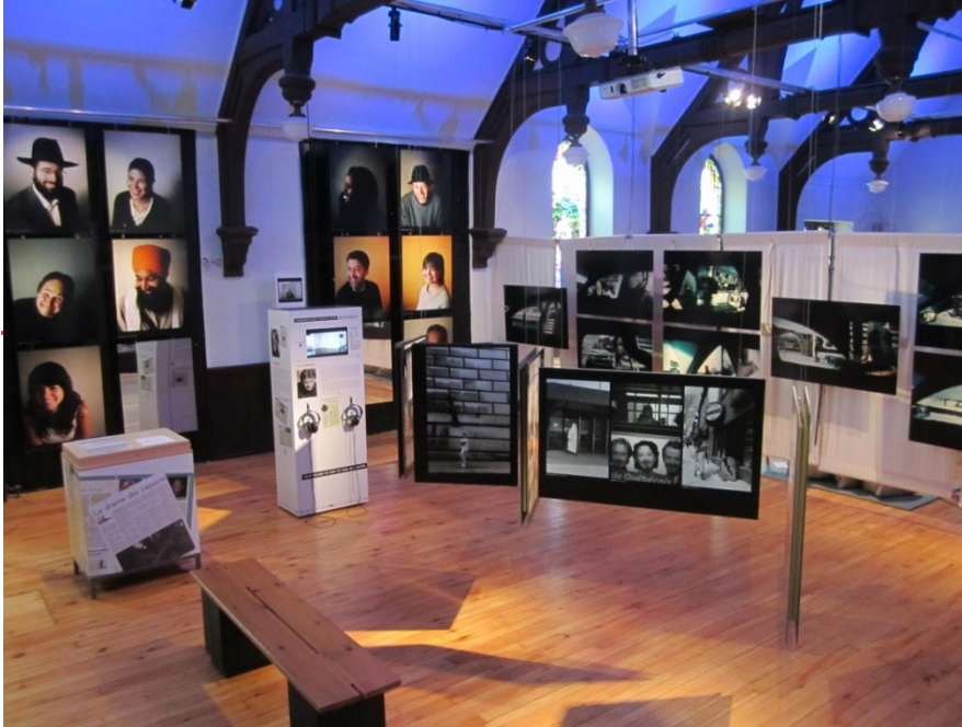
Exposition « Montre-moi ce que tu vois de l'autre que je ne vois pas » (hiver 2013)