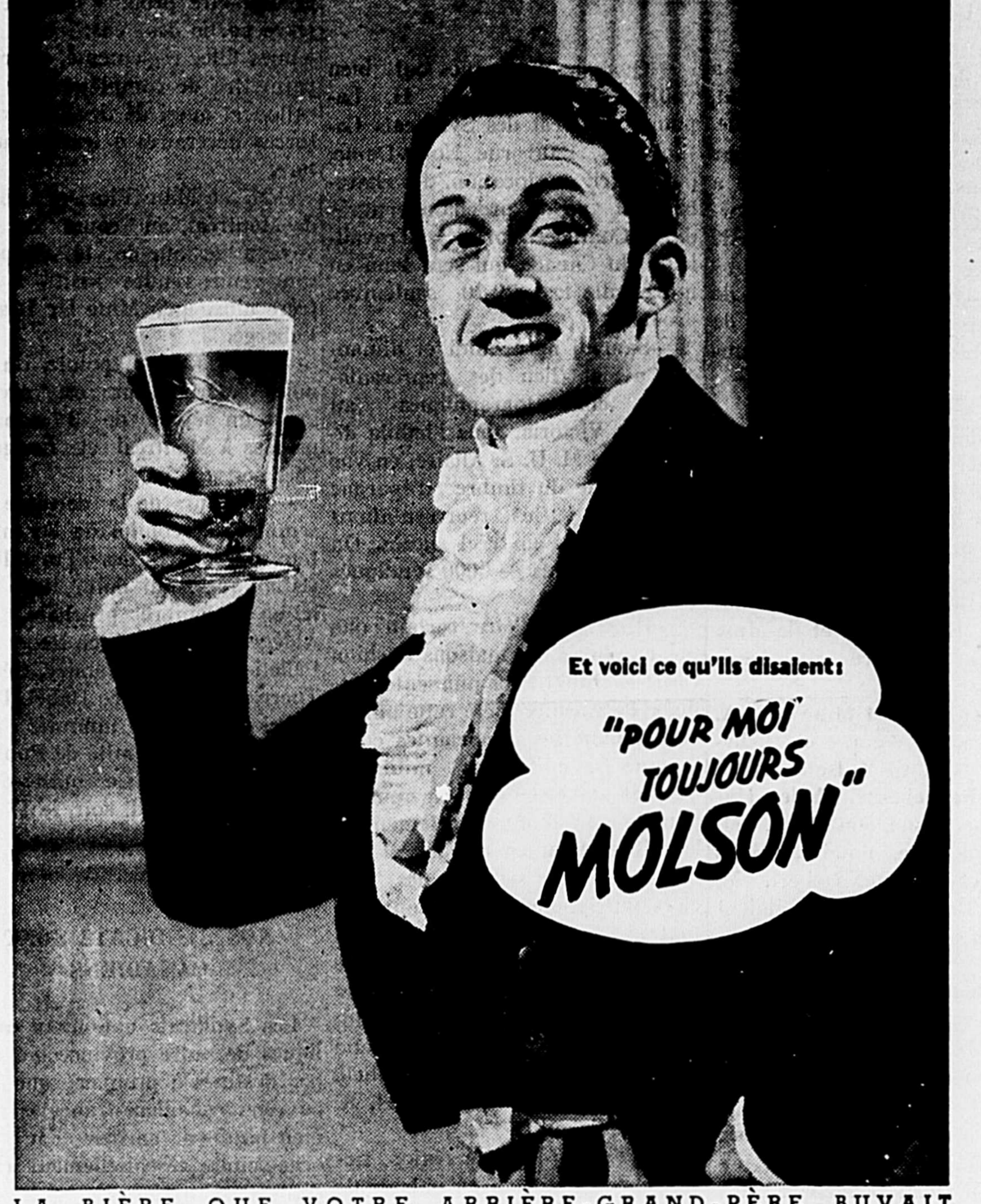
LA BIÈRE QUE VOTRE ARRIÈRE-GRAND-PÈRE BUVAIT

cord) parfaitement et les égrapper. Enlever la peau. Faire cuire la pulpe pendant dix minutes. Passer par un tamis fin pour enlever les graines. Mélangier la pulpe, la peau et le sucre et faire bouillir doucement jusqu'à 221 degrés F. ou à 20 livres.