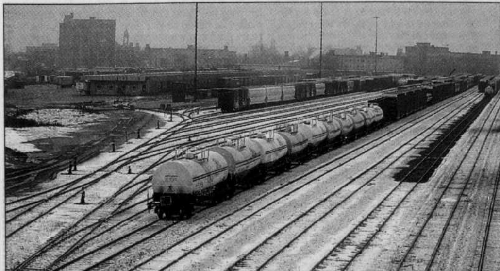
La cour de triage du CN qui fait tant parler.