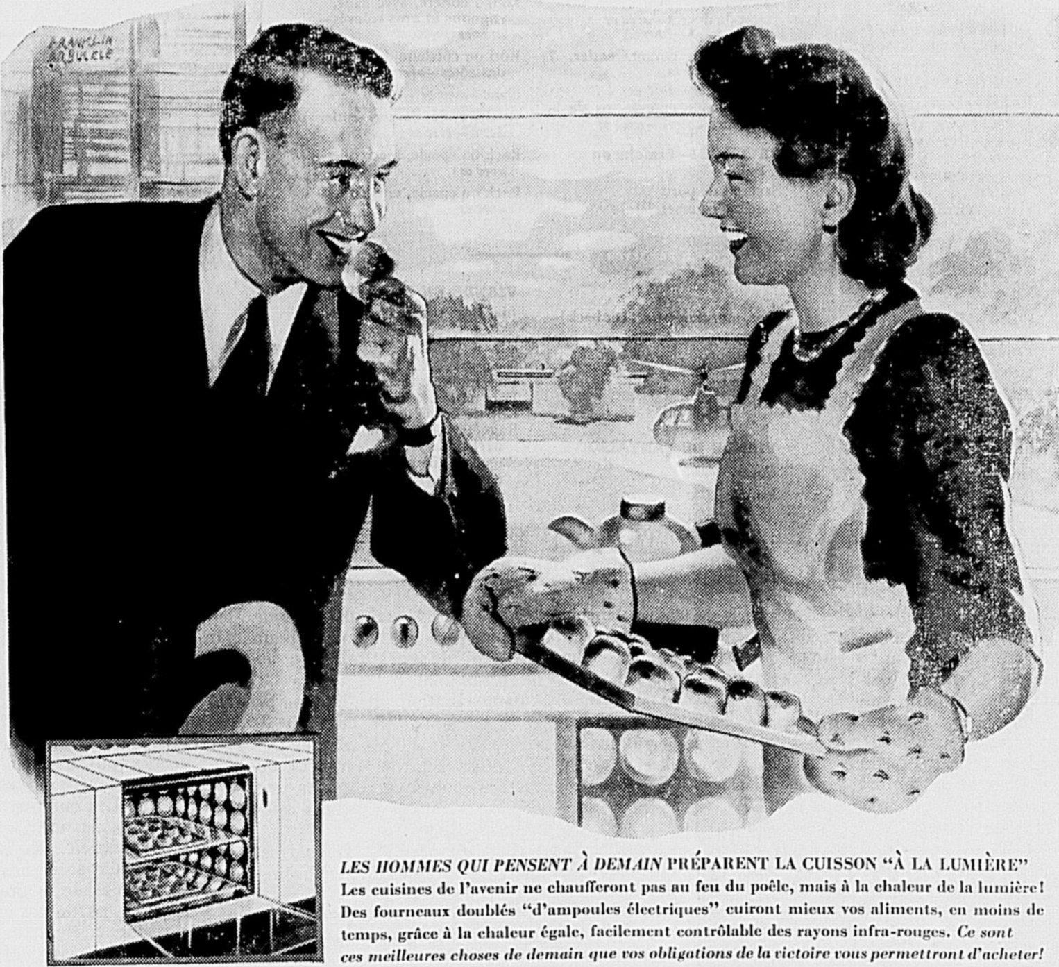
LES HOMMES QUI PENSENT À DEMAIN PRÉPARENT LA CUISSON "À LA LUMIÈRE" Les cuisines de l'avenir ne chaufferont pas au feu du poêle, mais à la chaleur de la lumière! Des fourneaux doublés "d'ampoules électriques" émettent mieux vos aliments, en moins de temps, grâce à la chaleur égale, facilement contrôlable des rayons infra-rouges. Ce sont ces meilleures choses de demain que vos obligations de la victoire vous permettront d'acheter!