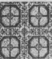
Plaza Roma* classique motif méditerranéen rappelant les tuiles peintes à la main, en sept couleurs fascinantes.