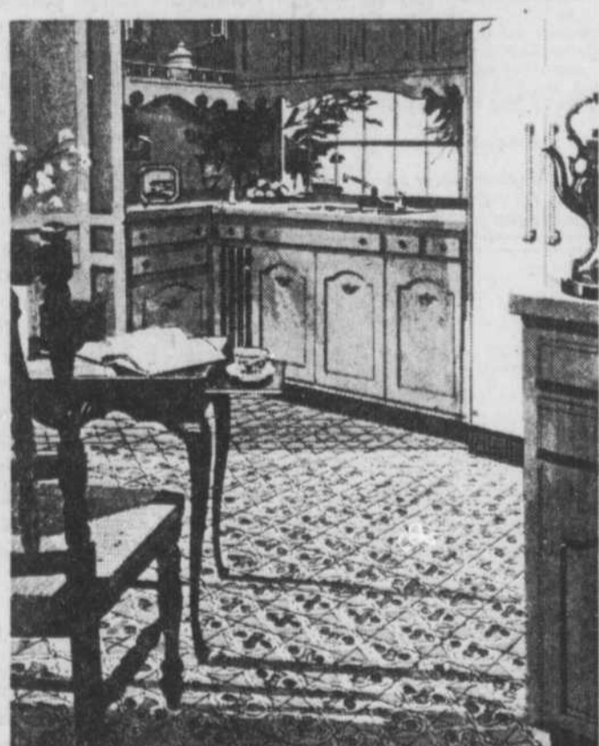
Country Spice* motif de moisson d'automne à l'apparence de carreaux incrustés, en six fraîches teintes naturelles.

pour une pièce de 9' sur 12' (installation non comprise)