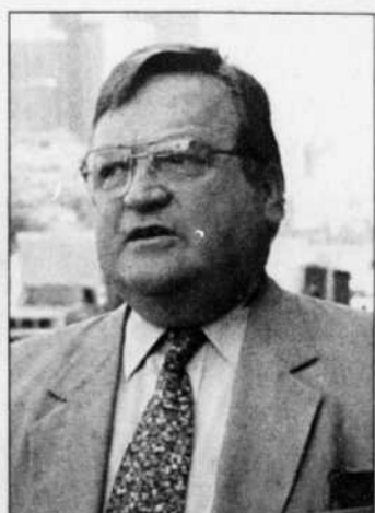
Jean Garon