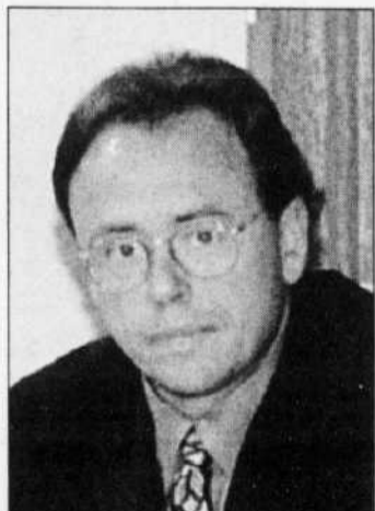
ARCHIVES PRESSE CANADIENNE Yves Ducharme

La ville de Lévis, résultat de la fusion de plusieurs villes dont Lévis, Charny, Pintendre, Saint-Etienne-de-Lauzon et Saint-Nicolas, comptera 125 000 habitants.