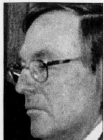
ARCHIVES PRESSE CANADIENNE Jean Perrault