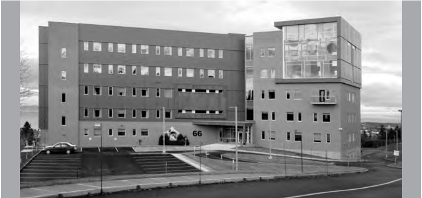
Maison-mère à Rivière-du-Loup au Québec.

Plus de cent ans à Rivière-du-Loup : Tout au long de l'année dernière, des activités ont été réalisées pour souligner dans la reconnaissance et l'action de grâce, notre 100 e anniversaire d'arrivée à Rivière-du-Loup.