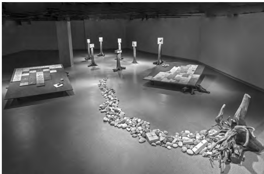
# 184, Imagerie de l'h  riti  re , 2011    2015, Granit, marbre, calcaire, gr  s, ardoise, cailloux, cuivre, aluminium et bois Sculpture-installation de 1450 pi  , approximatifs.

Je vis pr  sentement    Sainte-Marie-de-Kent au Nouveau-Brunswick, mon village natal. Enfant unique pendant sept ans, ma solitude et la ferme o   j'ai grandi ont sans doute influenc   mon amour de la nature et mon int  r  t au dessin. D  s l'  ge de dix ans, j'ai suivi des le  ons de peinture d'une artiste copiste de ma r  gion jusqu'   mes seize ans, lors de mon entr  e dans la Congr  gation des Religieuses de Notre-Dame-du-Sacr  -C  ur. Depuis sa fondation en 1924, ma Communaut  , implant  e dans les r  gions acadiennes, a eu le souci de travailler    l'  ducation et    la promotion de la culture chez un peuple qui a longtemps lutt   pour sa survivance ; c'est l   que j'ai voulu servir.