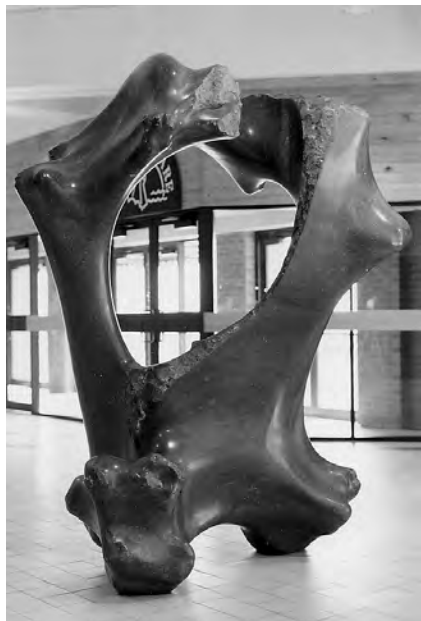
# 74, Ocean Bone/Oeuvre d'océan , 1983, (collection : ville de saint-Jean) Calcaire de Saint-Marc-des-Carrières, Qc. (225x180x120 cm)