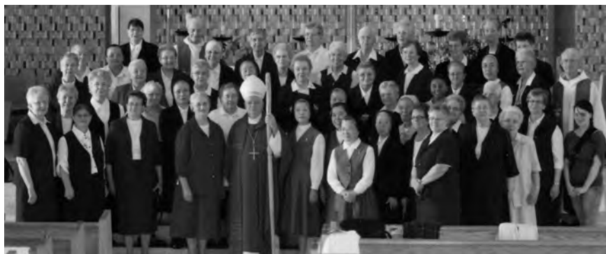
La communauté des Sœurs de l'Enfant Jésus de Chauffailles à l'église de Sept-Îles le 15 juillet 2012 à l'occasion du centenaire de l'arrivée des premières sœurs en terre québécoise sur la Côte-Nord.

Le projet évangélique de Reine Antier correspondait aux appels de son temps. C'est ce même projet que nous continuons de vivre aujourd'hui en l'adaptant aux besoins de l'Église et du monde selon notre charisme-mission : vivre en solidarité avec ceux et celles vers qui nous sommes envoyées. Avec notre Fondatrice nous voulons : « Jeter le passé dans la miséricorde de Dieu, donner le présent à l'Amour et abandonner l'avenir à la Providence ».