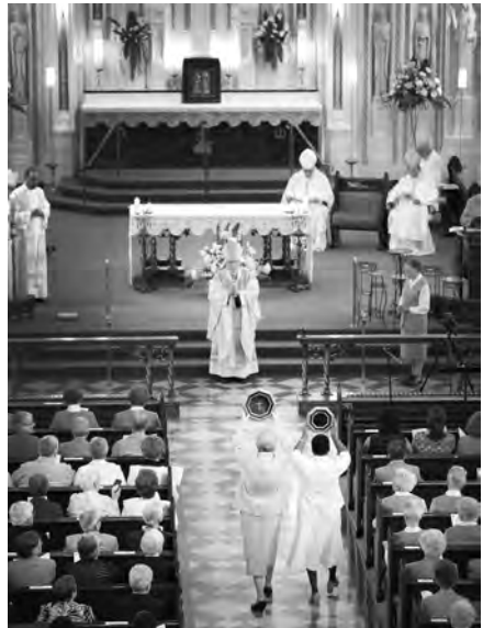
Croix et anneau de Mère Bruyère apportés dans la procession d'offrande.

Si ce 13 mai était un beau moment d'Église et un moment privilégié pour la vie consacrée, il était un grand moment de fierté et de joie profonde pour les Sœurs de la Charité d'Ottawa. Comme le 13 mai était avant tout la fête de l'Ascension, il faut dire que le mariage des deux fêtes s'alliait parfaitement. Les textes liturgiques nous conviaient à la sainteté, à l'espérance et à une mission à finir. Le texte de saint Paul qui parle de « parvenir à la plénitude de la stature du Christ » a trouvé une résonance particulière en ce jour. Élisabeth Bruyère avait pris au sérieux ce message et l'Église reconnaissait « la plénitude de la stature du Christ » en elle. Cet appel à la sainteté a façonné le cœur et la vie d'Élisabeth Bruyère.