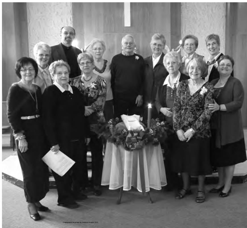
Le réengagement du groupe de Gatineau au printemps 2015.

pourront contribuer. Jusqu'en 2015, des délégués des divers pays participaient, tous les six ans, à un congrès international. C'était un lieu de formation spirituelle et de rencontre. Désormais, chaque pays organisera son propre congrès. Les liens entre les sœurs et les associés se nouent d'abord avec la communauté locale lors des rencontres ou des fêtes. Ils existent aussi avec la Congrégation : les associés ont été invités au pré-chapitre ; ils peuvent participer aux retraites des religieuses ; ils assistent à certaines fêtes communautaires. L'information circule grâce à la sœur accompagnatrice et au comité central.