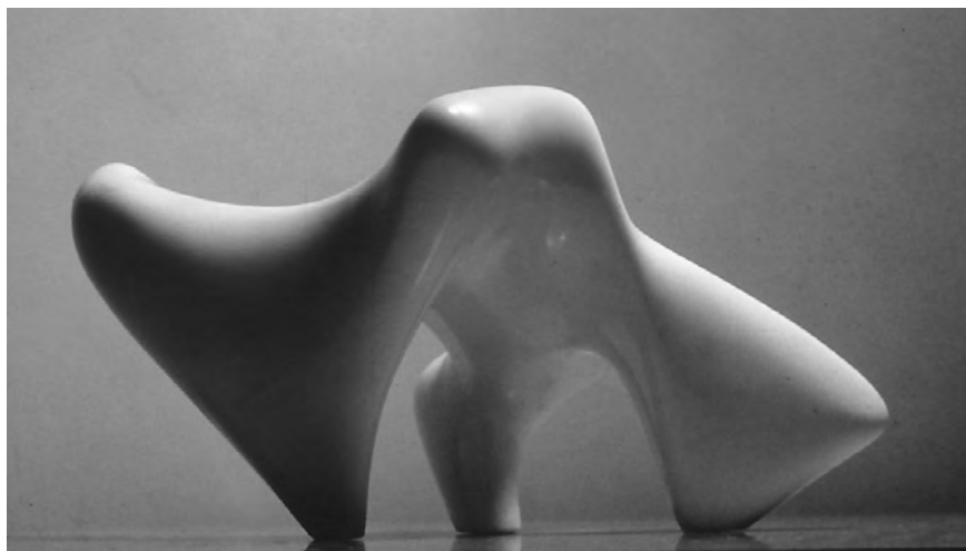
# 48, sans titre, 1978, Marbre de Carrare, Italie (21x27.5x37.5 cm)