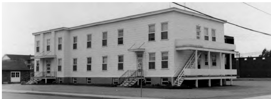
Hôpital de la Pocatière.