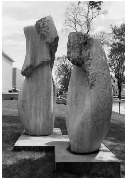
# 81, Awakening/Éveil , 1985, (collection : Galerie d'art Beaverbrook Art Gallery, Fredericton, N.-B.) Calcaire de Saint-Marc- des-Carrières, Qc. Hauteurs des pièces complémentaires (315 et 225 cm)