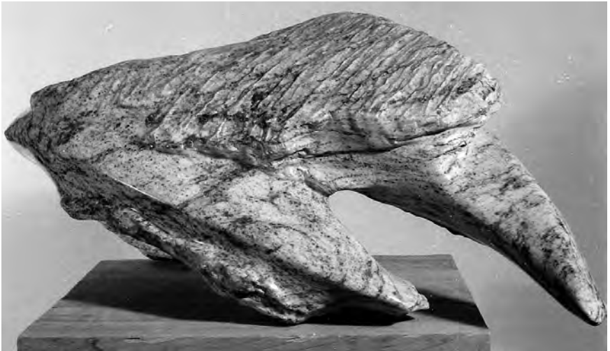
# 70, Relief marin , 1982, Calcaire des Iles de la Madeleine, Qc. (28x82x45 cm)