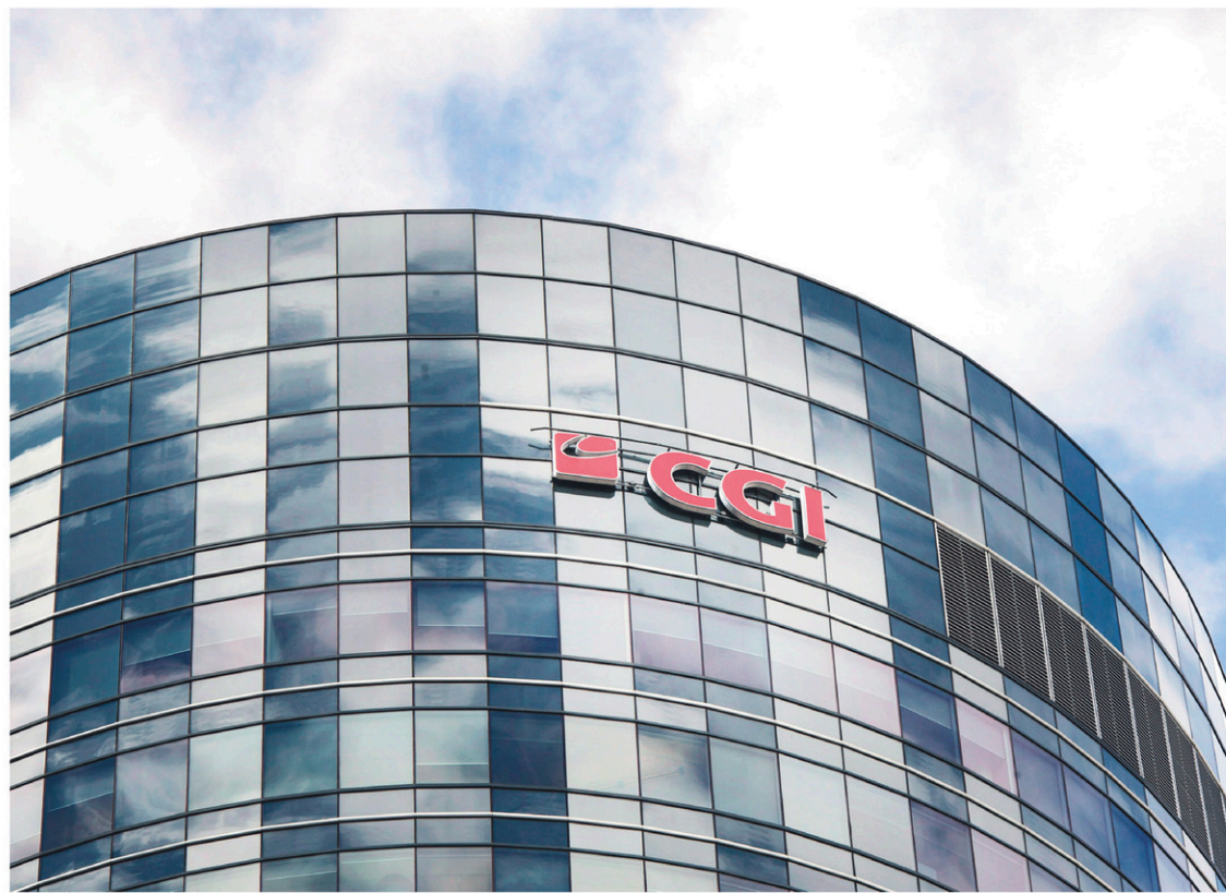
Le siège social de CGI, à Montréal. L'entreprise compte environ 7000 employés dans les Amériques, en Europe ainsi que dans la région de l'Asie-Pacifique.

L'offre publique d'achat est assujettie à un certain nombre de conditions, y compris l'approbation par les autorités réglementaires compétentes, dont les autorités de concurrence, et