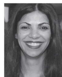
ASSMAE LOUDYI ALLIED