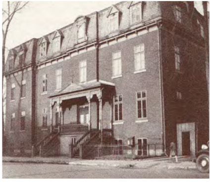
L'Académie chrétienne de Montréal

Il est plus que probable que le contrôle catholique sur l'éducation au Québec est ce qui a plus touché les nouveaux groupes évangéliques. Dans un système scolaire sommairement partagé selon la religion,