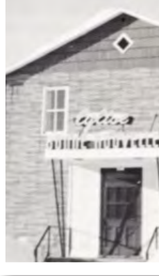
Église Bonne nouvelle, Senneterre

Les pentecôtistes francophones dans d'autres villes ont connu des pressions semblables de la part des prêtres. À Valleyfield, "quelques jeunes filles n'ont pu avoir d'emploi parce que le curé avait interdit aux gens de les prendre chez eux comme domestiques". En 1950, selon la même source, "on s'est permis à Montréal d'interrompre abruptement une émission de radio religieuse sans fournir d'autre explication que le fait qu'elle déplaisait à la hiérarchie romaine" 38 . Les émissions