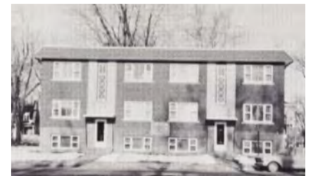
École biblique Bérée