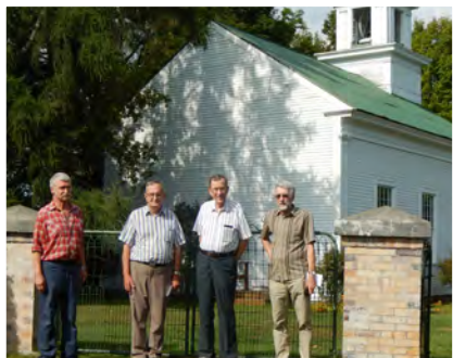
Au cimetière de Compton derrière l'église universaliste

La journée s'est terminée par la visite de deux cimetières assez éloignés l'un de l'autre, celui de l'église universaliste de Compton