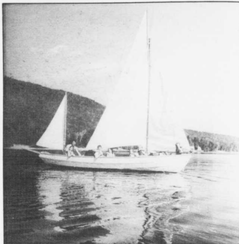
Pohénégamook: santé, détente relaxation, plaisir et plein air.

Sur ce dernier point, le centre de relaxation Le Sagittaire est de tout premier ordre. En opération depuis décembre 1988,