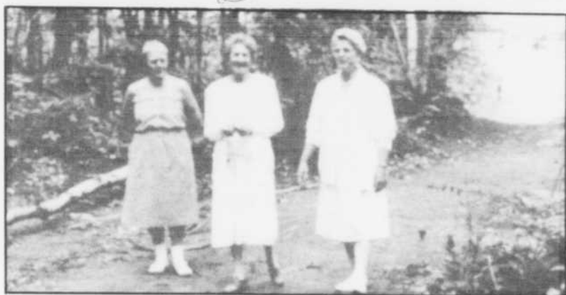
Vacances pour tous!