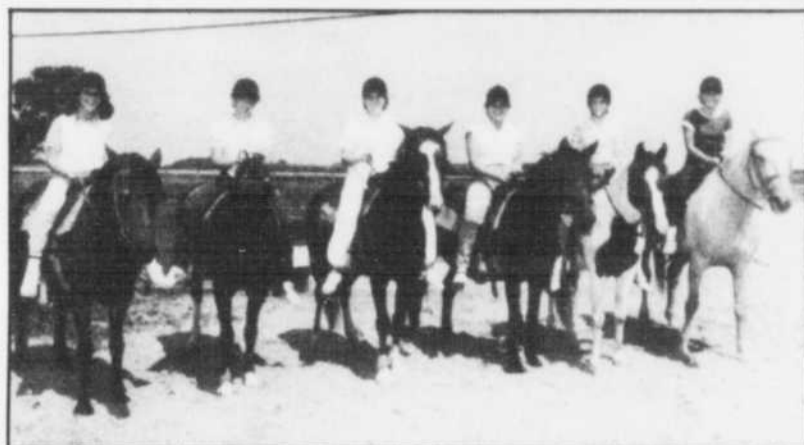
À pied, en voile ou à cheval... les camps de vacances, c'est super.

Au printemps, plusieurs camps invitent les parents et les enfants à visiter leurs sites. C'est une excellente occasion pour eux de rencontrer le directeur ou la directrice du camp, de voir, les installations, les équipements et l'hébergement.