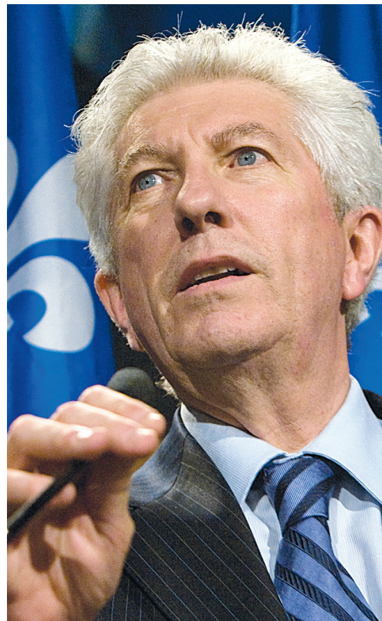
17 avril 2011: Pauline Marois s'adresse aux congressistes du PQ, après avoir obtenu la veille un vote de confiance de 93%. Derrière elle, deux des députés qui devaient quitter le navire péquiste en juin, Louise Beaudoin et Pierre Curzi. À droite, 2 mai 2011: Gilles Duceppe annonce sa démission comme chef du Bloc québécois, après le dévoilement des résultats des élections fédérales.