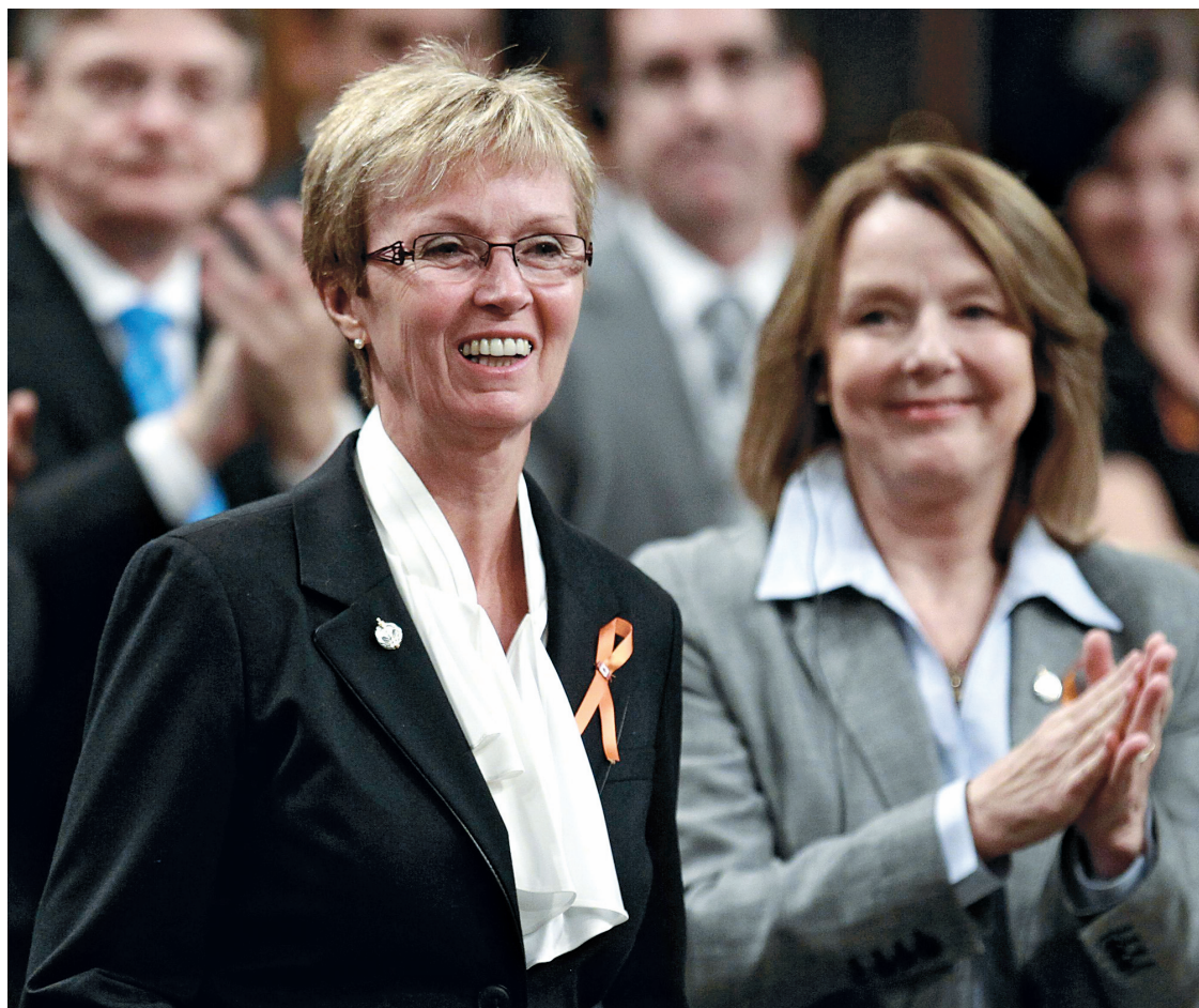
Nycole Turmel a été propulsée à la tête du NPD huit semaines après avoir été élue pour la première fois aux Communes.

«Non je n'étais pas prête pour ce travail-là [...] Ce serait prétentieux de dire que j'étais prête», estime-t-elle. D'autant plus qu'à la veille des élections, Nycole Turmel n'était même pas convaincue de devenir députée — encore moins leader politique. «On se rappelle qu'en février-mars, on parlait d'une possibilité de faire