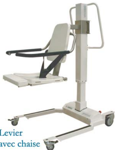
Levier avec chaise