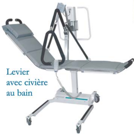
Levier avec civière au bain