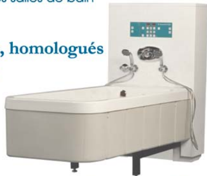
Baignoire à hauteur variable

Produits durables, sécuritaires, homologués Meilleure garantie du marché Meilleur rapport qualité/prix