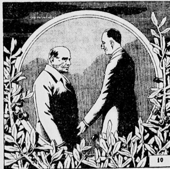
X. - LA MISSION SUMNER WELLS

Ces images existent en vues de projection pour écoles, chez Miro, 33, Boulevard Saint-Martin, Paris.