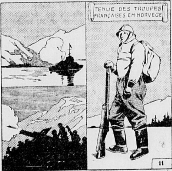
XI. - LA GUERRE EN NORVEGE

Un grand pays observait cependant de près la marche des événements: les Etats-Unis d'Amérique. On savait bien que la grande Démocratie d'au delà des mers ne pouvait pas ne pas regarder d'un oeil favorable la cause des démocraties d'Occident. Que d'appels celles-ci n'avaient-elles pas lancé à leur puissante cadette... Et combien d'espoirs étaient tournés vers la gigantesque et symbolique statue de New-York? Mais l'Amérique restait neutre, et Mars 1940 voyait arriver en Europe un envoyé spécial du Président Roosevelt. Enigmatisant, effaçant les nécessités d'une mission d'observation impartiale, le diplomate américain, Sumner Wells fit le tour des capitales des pays en guerre, et sphinx moderne, après avoir conversé avec chacun des chefs des gouvernements ennemis, recueillait sans rien laisser transparaître de ses impressions et des intentions de l'Oncle Sam.