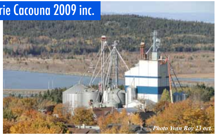
23 oct.

La MRC des Basques et la Première Nation Malécite de Viger souhaitent l'intervention du gouvernement du Québec afin de créer le Parc Inter-Nations et redonner accès à la population à un territoire public de quelque 150 kilomètres carrés, dont l'accès est présentement restreint par les privilèges exclusifs accordés à un club privé de chasse et de pêche. Partenariat unique au Québec, le projet prévoit le développement d'activités touristiques, de plein air et d'hébergement, de même que l'établissement d'un hôtel, d'un restaurant, d'un musée et d'un centre de ressourcement. Les droits de chasse à l'original y seraient déterminés par tirage au sort, accessible à tous, dans le respect de la Loi sur la conservation et la mise en valeur de la faune.