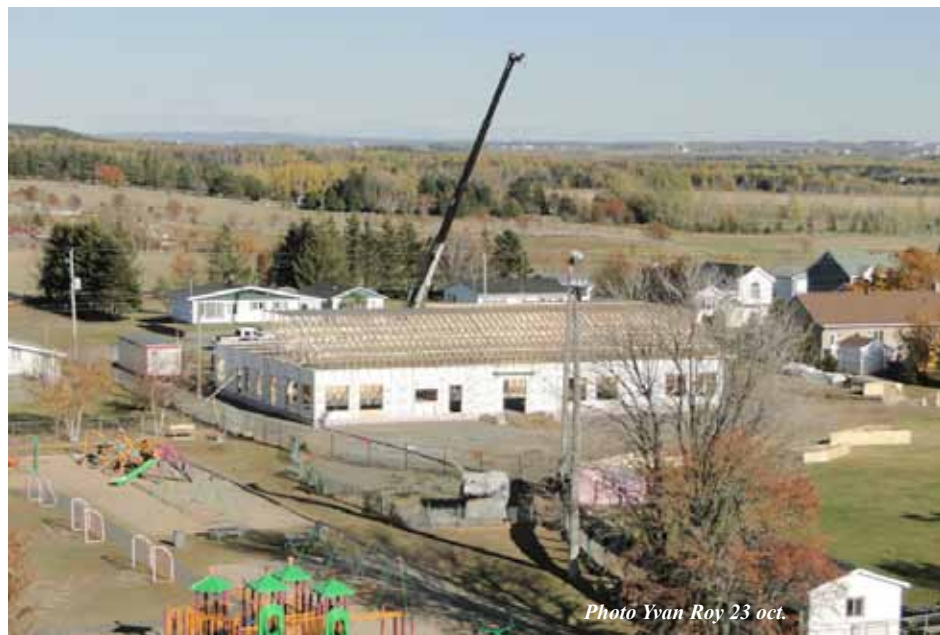
23 oct.