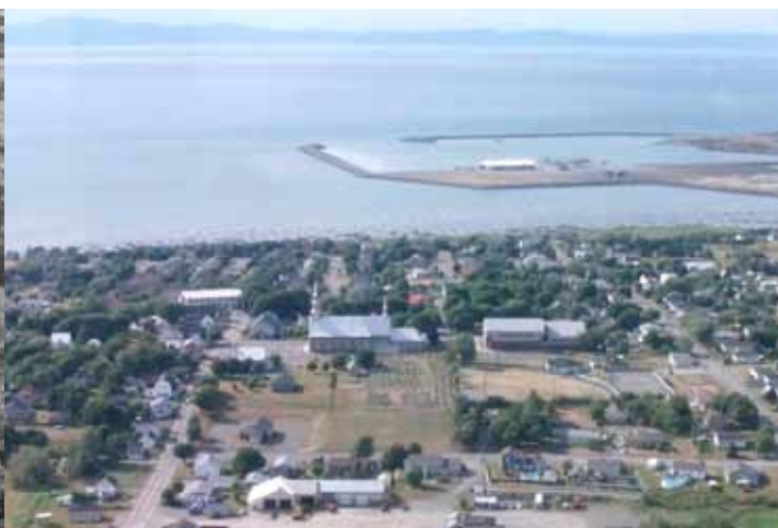
Au début des années 1980...