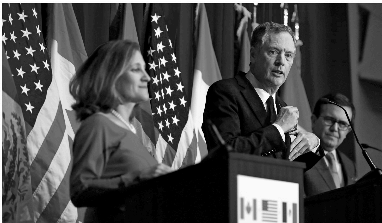
La ministre canadienne des Affaires étrangères, Chrystia Freeland, et ses deux homologues, Robert Lighthizer et Ildefonso Guajardo Villarreal, doivent arriver dans la métropole montréalaise dimanche pour faire le point sur les progrès accomplis.