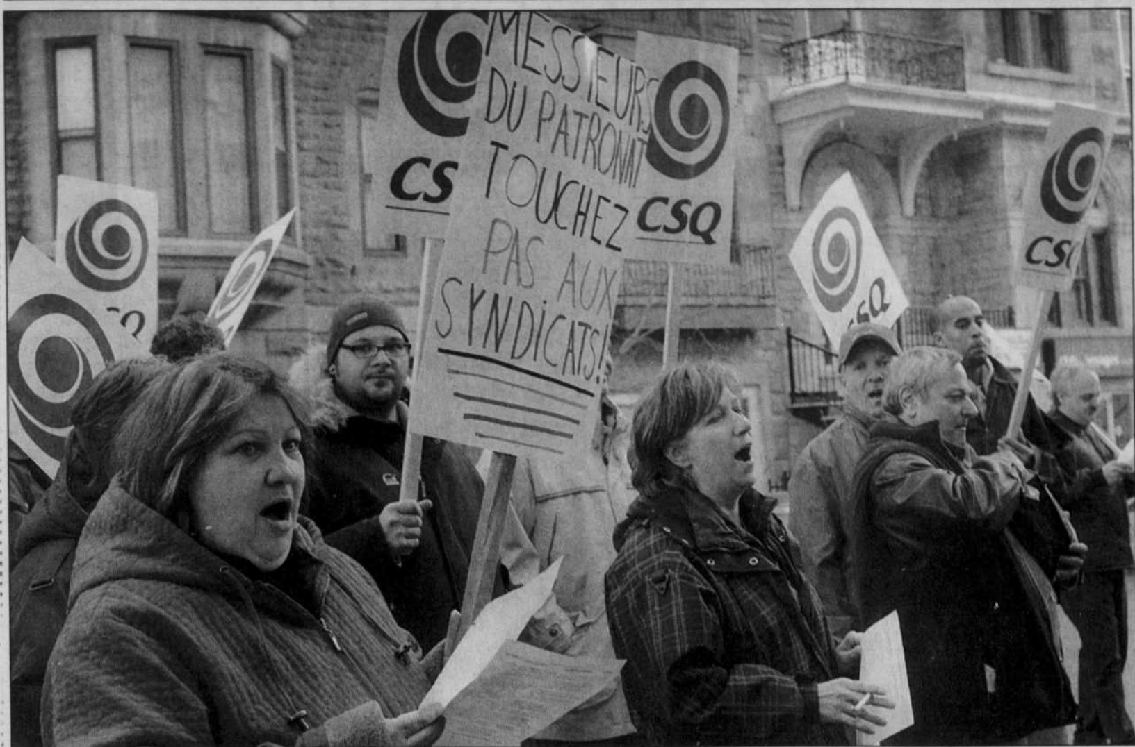
Les syndicats sentent qu'ils ne peuvent plus compter sur un partenariat aussi privilégié avec l'État, ce qui explique l'ampleur de leur colère.