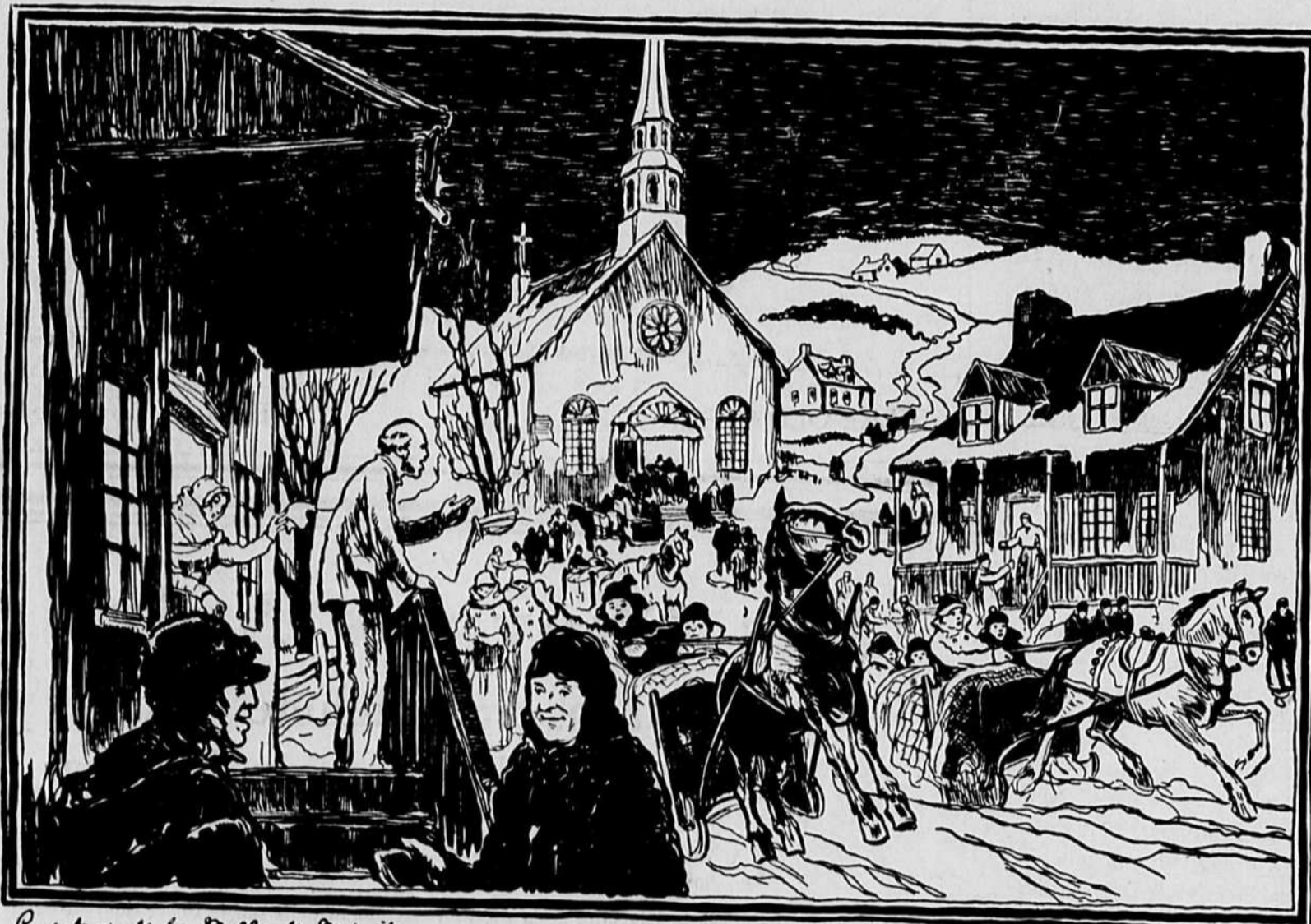
Le retour de la Messe de Minuit.