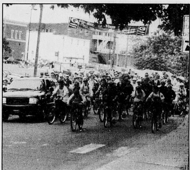
Quelque 1500 adeptes du vélo ont pris part, hier à Drummondville, à la 11e édition du Rendez-vous du vélo de l'endroit. Débutée sous un beau soleil, la randonnée s'est terminée sous la pluie.