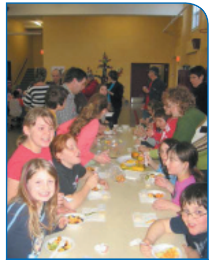
Sur la photo : Des élèves de l'école Notre-Dame-du-Sacré-Cœur de Barraute à l'occasion d'une dégustation de fruits.

De tels changements de comportement peuvent prendre plusieurs années. La mobilisation de tous les acteurs, dont les parents, a fait toute la différence. Cependant, le défi des saines habitudes de vie demeure préoccupant. Pour maintenir les gains accumulés et poursuivre sur cette lancée, il exigera encore l'implication soutenue de tous les intervenants.