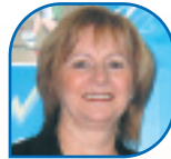
DÉLIMA VALLÉE-LAROSE Commissaire