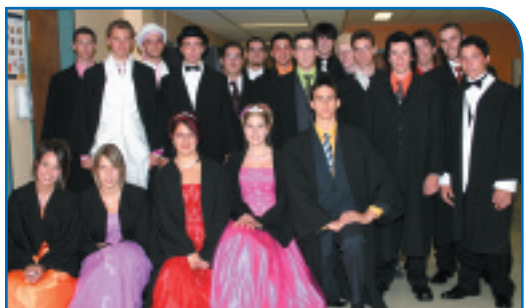
Un groupe de finissants en tenue de bal célèbrent leur réussite (juin 2006).

Le taux de diplomation des élèves de la Commission scolaire Harricana a augmenté de 6 %, passant de 53 % en juin 2005 à 59 % en juin 2006. Il a augmenté de 1 % en ce qui concerne la diplomation après 7 ans.