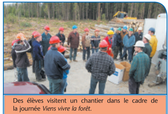
Des élèves visitent un chantier dans le cadre de la journée Viens vivre la forêt .

Plus de 300 jeunes d'écoles secondaires de la région ont participé à cette activité. Par des présentations et de l'expérimentation, ils viennent y découvrir les métiers de la formation professionnelle, du cégep et de l'université du secteur forestier.