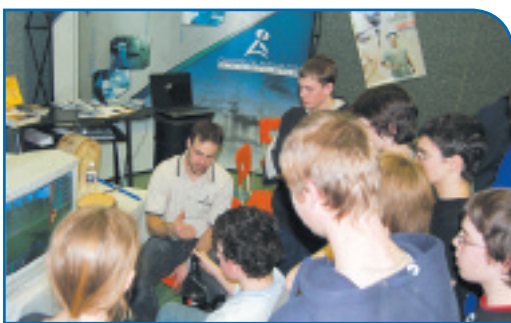
Au Salon des sciences et de la technologie, des élèves attentifs aux propos d'un enseignant du secteur de la foresterie.