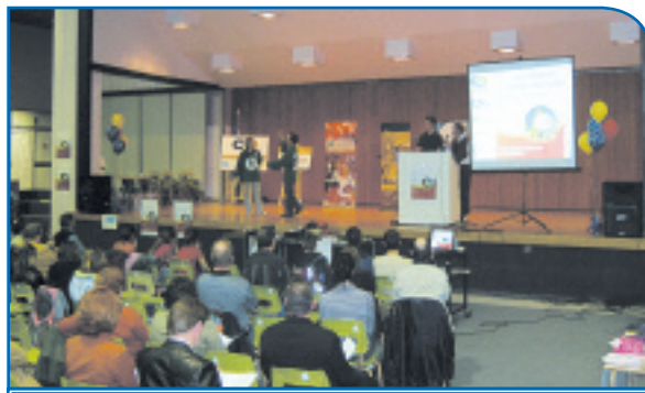
Le gala des lauréats locaux de la 9 e édition du concours.

Mettre en place un modèle de partenariat avec l'école, la famille et la communauté permettant l'engagement de l'élève dans son milieu.