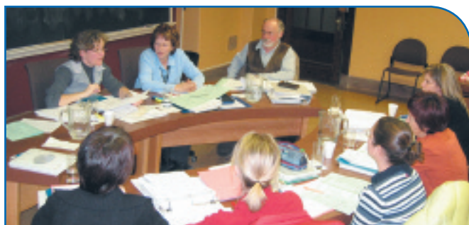
Des enseignants en formation.

Pour l'année scolaire 2006-2007, une deuxième cohorte d'enseignants a terminé le programme de formation continue d'enseignement stratégique. Avec deux cohortes de finissants et une troisième en cheminement, un petit vox pop a été effectué auprès des participants pour connaître les effets de cette approche pédagogique liant la méthode d'enseignement au mode d'apprentissage de l'élève.