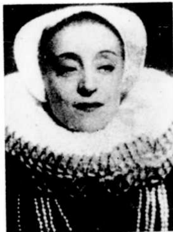
Françoise Rosay dans "La Kermesse héroïque" de Jacques Feyder à l'affiche du "Ciné-club" le mardi soir 2 juin à 11 heures.

7.00—Aujourd'hui Animateurs: Michelle Tisseyre et Jacques Languirand. 8.00—Rue de l'Anse "La Morue". Eglantine et Rosette découvrent une croix enfouie dans le sable. 8.30—Tête d'affiche Le cirque, directement du Parc Jarry, à Montréal. 9.30—Un, deux, trois... rideau! "La Rivale". Madame est végétarienne, et son mari qui en souffre se permet quelques bons repas dans les restaurants. 10.00—Réalités économiques L'Exploitation des mines et le développement de la région de l'Abitibi-Témiscamingue. 10.30—Téléjournal 10.45—Supplément régional CBOFT—Dernière édition 10.50—CBOFT—Nouvelles du sport 10.55—Nouvelles du sport 11.00—Ciné-club "La Kermesse héroïque", comédie de Jacques Feyder, avec Françoise Rosay, Jean Murat, Louis Jouvet et Alerme. Une armée espagnole se dirige vers un village de Flandre. Pour prévenir un malheur, le bourgmestre se fait passer pour mort dans l'espoir que les Espagnols respecteront une ville en deuil.