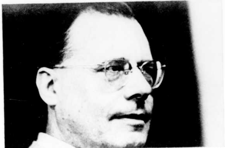
Le mardi 2 juin à 3 heures, l'émission "Les Chefs-d'oeuvre de la musique" présentera la Symphonie "Alpestre" de Richard Strauss, sous la direction de Karl Böhm (notre photo).