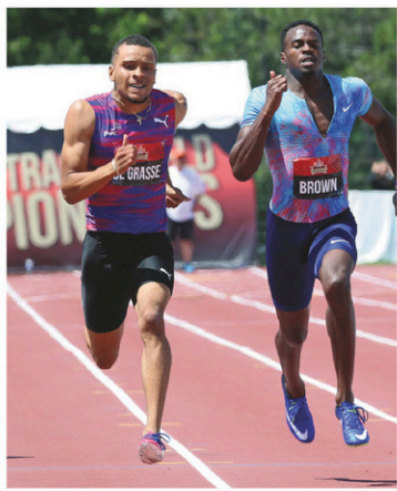
Andre De Grasse est arrivé en tête du 200 m.