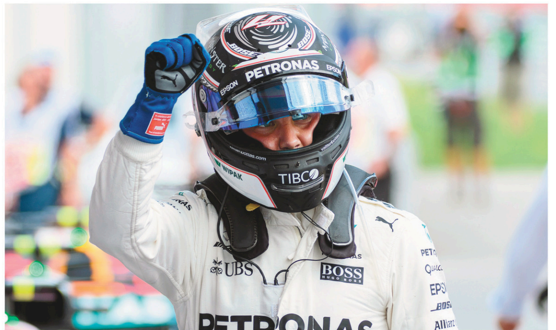
Le pilote de Mercedes Valtteri Bottas a su profiter de sa première place sur la grille de départ.

Le pilote Ferrari Sebastian Vettel a pris le deuxième rang et le pilote Red Bull Daniel Ricciardo a complété le podium. Bottas en a fait juste assez pour empêcher Vettel de le rattraper, et l'Allemand a croisé le fil d'arrivée avec un retard de seulement 0,6 seconde. «Il me rattrapait. J'étais ennuyé par un important plat sur mon pneu arrière gauche, a confié Bottas. Je perdais de plus en plus de stabilité à l'arrière.