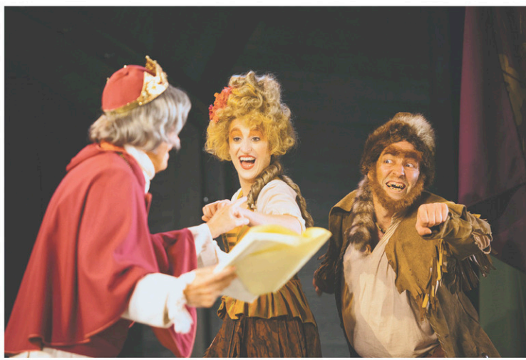
La pièce Molière, Shakespeare et moi exhibe tout du long son côté carton-pâte et sa jovialité un peu forcée.