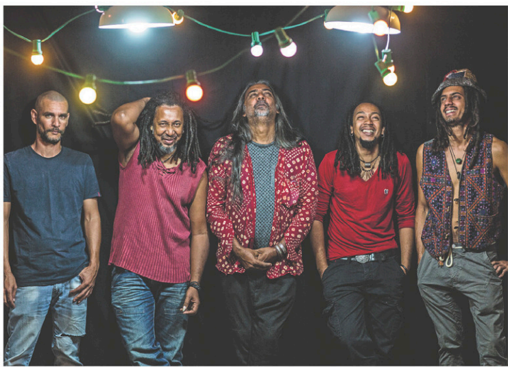
Quarante ans après ses débuts, Ziskakan est à Québec et à Montréal pour l'une de ses rares visites au Québec.