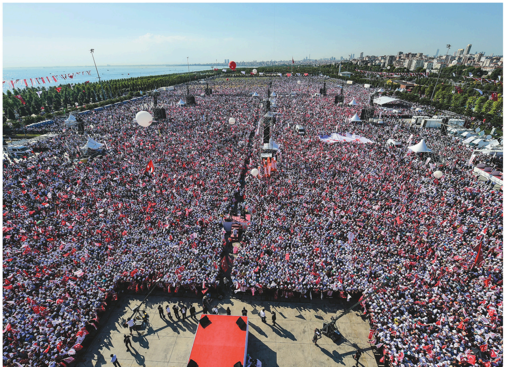
Plusieurs centaines de milliers de personnes se sont réunies à Istanbul pour marquer la fin de la «marche pour la justice» de Kemal Kılıçdaroglu.

François Brousseau est chroniqueur d'information internationale à Ici Radio-Canada. Cette chronique fait relâche pour l'été. De retour le 21 août. francbrousseau@hotmail.com