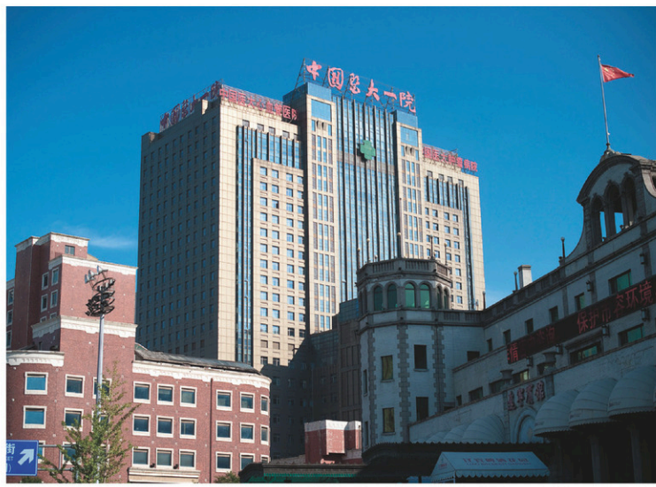
L'Hôpital universitaire médical n° 1 de Shenyang, où Liu est traité, avait indiqué samedi qu'il serait « dangereux » pour lui d'être transféré.

Les spécialistes américain et allemand ont « constaté la qualité des soins » dispensés à M. Liu à l'hôpital chinois. Mais