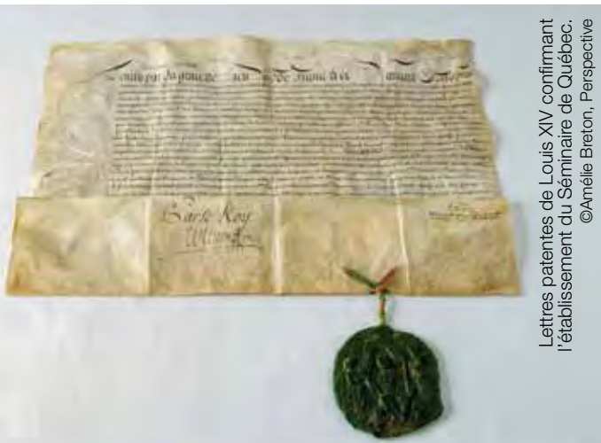
Lettres patentes de Louis XIV confirmant l'établissement du Séminaire de Québec.

Le Fonds du Séminaire de Québec, 1623-1800, qui fait partie de la collection du Musée, est inscrit au prestigieux Registre Mémoire du monde de l'UNESCO. Il rejoint ainsi de précieux documents témoins des grandes étapes de l'histoire telles la Déclaration des droits de l'homme et du citoyen, la Bible de Gutenberg ou encore la symphonie no 9 de Beethoven. Le Fonds est constitué de nombreux documents d'une valeur historique inestimable puisqu'il témoigne de la migration, de l'implantation, de la continuité et du rayonnement de la culture française ainsi que de la spiritualité catholique en Amérique du Nord. Il confirme également le rôle déterminant de Québec, ville inscrite sur la Liste du patrimoine mondial de l'UNESCO, dans les échanges entre l'Ancien et le Nouveau Monde.