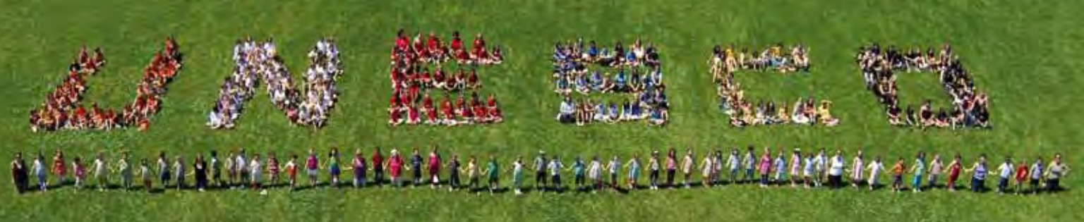
Les élèves de l'École alternative l'Atelier.