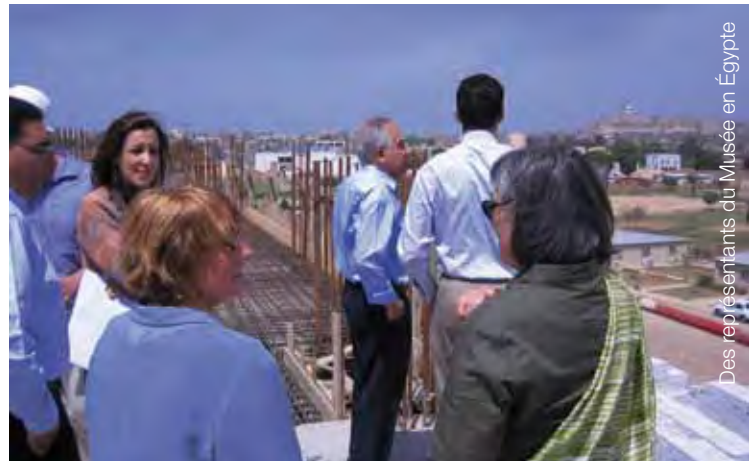
Des représentants du Musée en Égypte

Le Musée complète ses activités de coopération avec l'Égypte en siégeant au comité exécutif de la Campagne internationale pour l'établissement du Musée de la Nubie à Assouan et du Musée national de la civilisation égyptienne au Caire, sous l'égide de l'UNESCO. Cette reconnaissance confirme l'expertise acquise par le Musée de la civilisation et démontre que l'institution est devenue une référence internationale en muséologie.