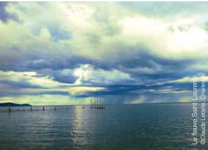
Le fleuve Saint-Laurent ©Claude Letarte, Charlevoix