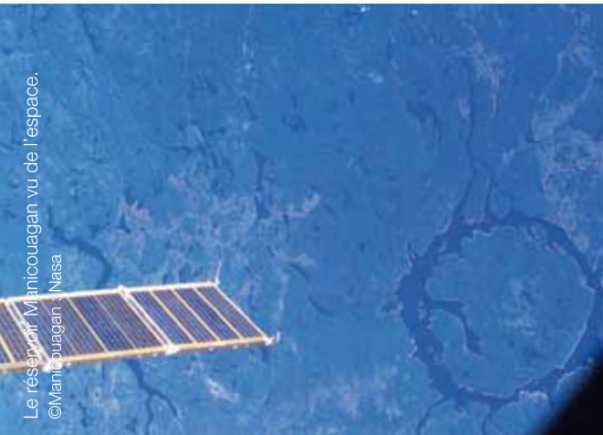
Le réservoir Manicouagan vu de l'espace.