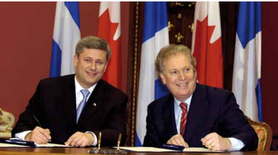
Le premier ministre du Canada, M. Stephen Harper, et le premier ministre du Québec, M. Jean Charest, lors de la signature de l'Accord.