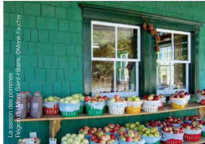
La saison des pommes Région du Mont Saint-Hilaire.

Les richesses du mont Saint-Hilaire ont façonné et inspiré au fil du temps peintres, auteurs, musiciens et conteurs. Acteur influent de la prise de conscience environnementale dans la région, la Réserve de la biosphère du mont Saint-Hilaire présente aujourd'hui des exemples éloquentes de coexistence harmonieuse avec la nature. Chaque année, on y réalise plusieurs dizaines de projets qui permettent notamment de protéger et de restaurer les milieux naturels de la région, de mettre en valeur ses corridors forestiers, d'outiller et d'accompagner les acteurs du milieu, de planifier une urbanisation responsable tenant compte des milieux naturels et d'encourager l'agrotourisme.