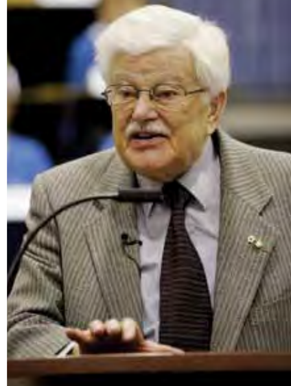
Paul Gérin-Lajoie.

En mars 2008, l'UNESCO me décernait la Médaille d'Or Albert Einstein, remise à des personnalités qui se sont illustrées par leur contribution exceptionnelle à la coopération internationale. J'ai été d'autant plus touché par cet honneur que la mission de l'UNESCO, soit de contribuer à l'édification de la paix et à l'élimination de la pauvreté par l'éducation, rejoint les valeurs qui ont depuis toutes ces années motivé mon engagement auprès des enfants.