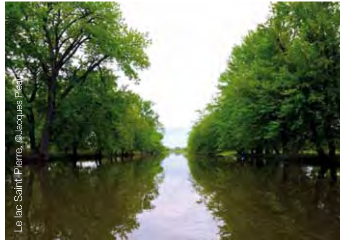
Le lac Saint-Pierre.

La Réserve contribue aussi au développement nautique et agroenvironnemental de la région afin de mettre en valeur ce majestueux territoire. Elle favorise ainsi une meilleure cohabitation entre l'homme et la biosphère, et ce, en misant sur l'éducation et la sensibilisation pour faire face aux problématiques d'usage du territoire.