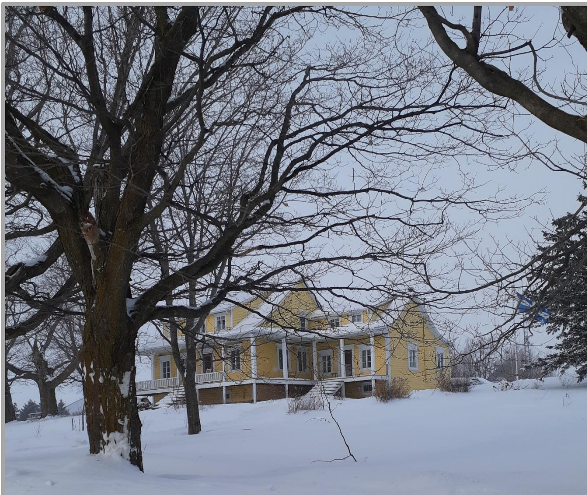
La maison de la famille Delagrave sur le lot 27 au 1040, rang Nord, Saint-Pierre-de-la-Rivière-du-Sud. Photo : Yvon Genest, le 23 janvier 2022

La terre de la Fabrique sur la concession de Laurent Daniau Les lots 27, 27a et 28 du cadastre de 1875 Saint-Pierre-de-la-Rivière-du-Sud