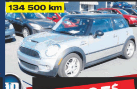
2008 MINI COOPER HARD TOP S 134 500 km