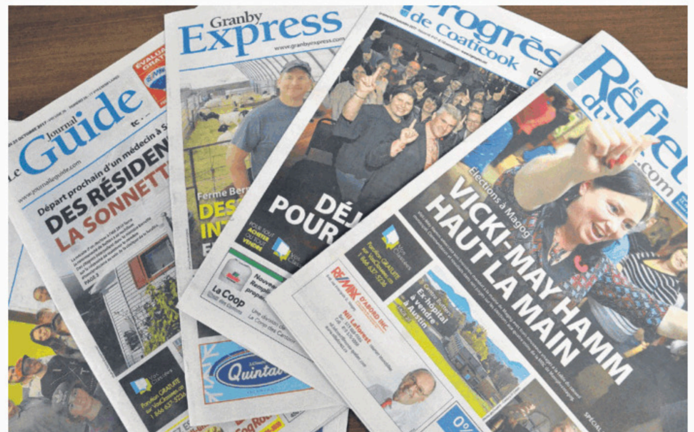
Les hebdos de Magog, Coaticook, Granby, Cowansville et Farnham passent entre les mains de l'entreprise Icimédias.