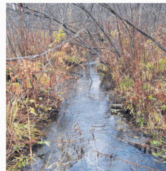
The newly-protected section of the stream is a haven for minnows and fish.

The BLLF is recognized as a charitable institution under Canadian and Quebec laws. So for those interested in supporting the group's activities, donations of money and land are treated as charitable donations for tax purposes. Furthermore, land with high ecological value enjoys special tax advantages.