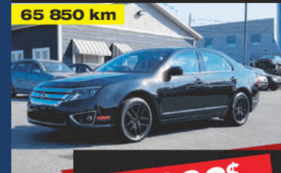
2011 FORD FUSION SEL V6 65 850 km