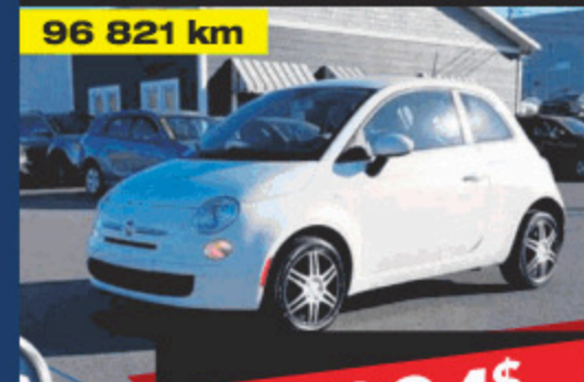
2012 FIAT 500 POP 96 821 km