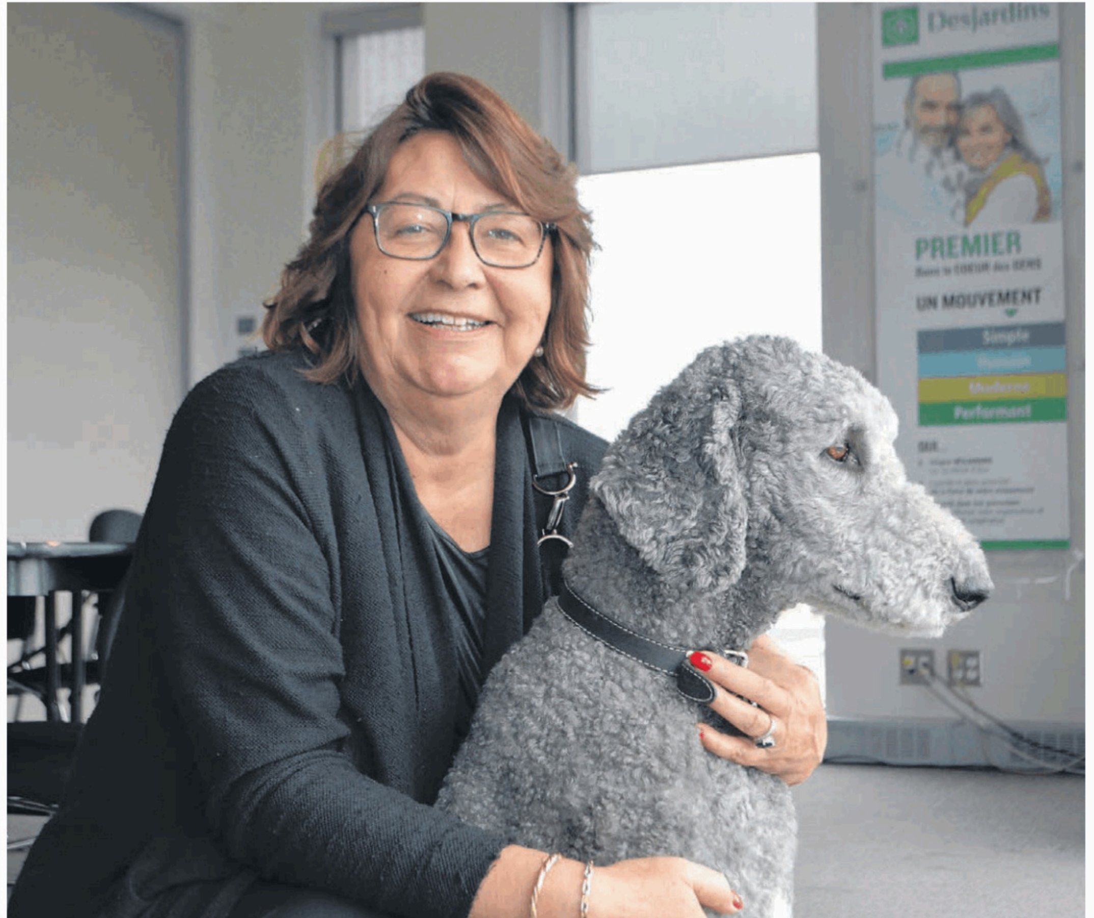
La députée Claire Samson doit une fière chandelle à Pepper, son chien d'assistance, qui l'accompagne dans tous ses déplacements.

Lors de son élection, en avril 2014, Claire Samson s'est adressée au président de l'Assemblée