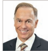
André Sirard Financière des professionnels