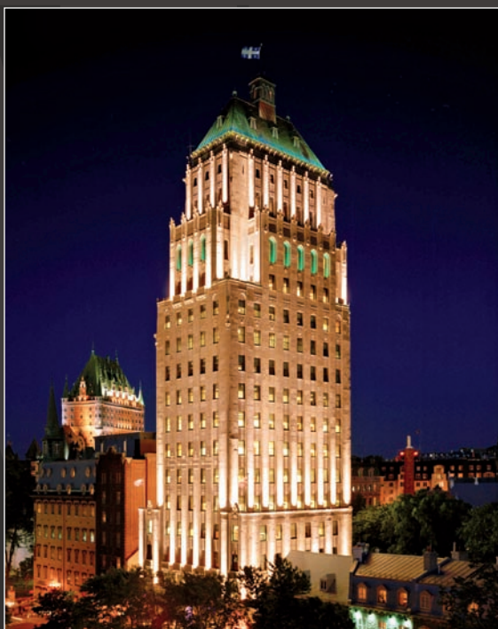
Édifice Price 65, rue Sainte-Anne Québec

Le Collège cherche constamment à offrir à sa clientèle des conditions répondant à ses besoins. Les formations sont offertes tant à Montréal qu'à Québec et ce, à des dates variées sur une base annuelle facilitant ainsi la conciliation des agendas déjà fort chargés des participants. Ils peuvent ainsi progresser à leur rythme, tout en bénéficiant de salles de grande qualité, situées au cœur des centres-villes de Québec et Montréal. Les participants profitent aussi d'une équipe de professeurs et d'intervenants renommés, passionnés et engagés. C'est sans doute pour l'ensemble de ces raisons que ces derniers n'hésitent pas à s'en déclarer satisfaits et à recommander chaudement le Collège à leurs pairs.