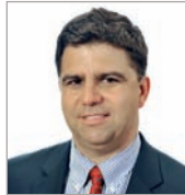
Pierre P. Séguin Services préhospitaliers Laurentides Lanaudière