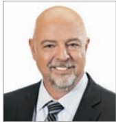
Norman Ross Norman Ross avocat inc.