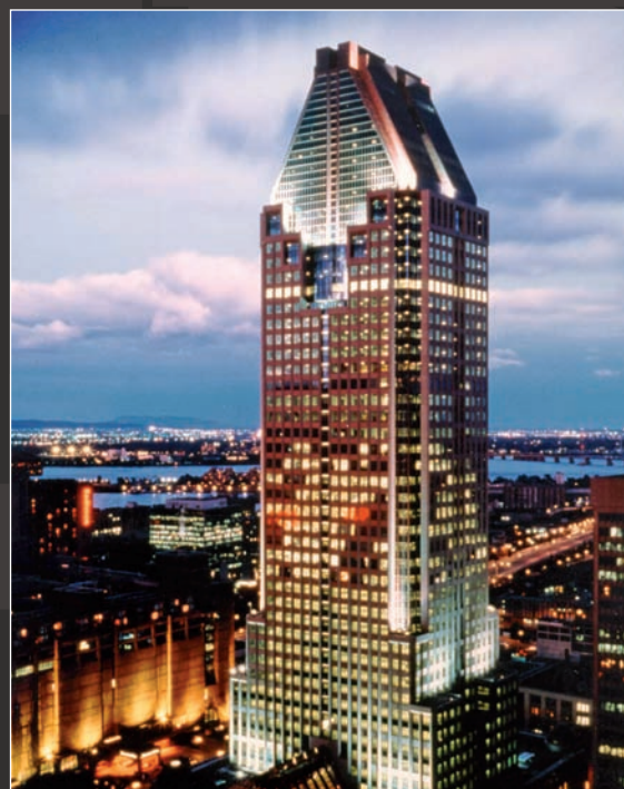
Centre de conférences Le 1000 1000, rue De La Gauchetière Ouest Montréal

Note : Les salles de formation du Collège sont une gracieuseté de la Caisse de dépôt et placement du Québec et sa filiale immobilière Ivanhoé Cambridge.