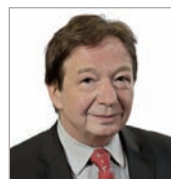
Éric Fournier TÉLÉFÉRIC inc.