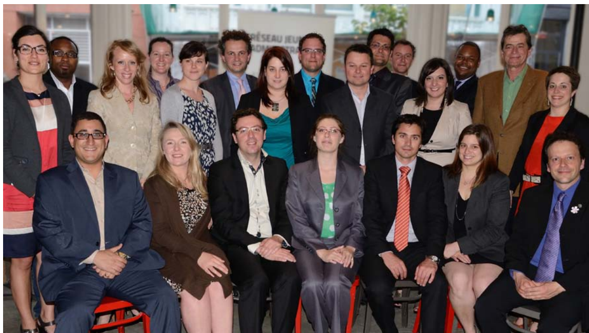
La 5 e cohorte de Jeunes administrateurs lors de l'activité Speed-board dating .

Soucieux de préparer les jeunes à exercer efficacement des rôles d'administrateur tout en leur permettant d'élargir leur réseau, le Collège des administrateurs de sociétés s'est associé, pour une deuxième année, à la Jeune chambre de commerce de Montréal (JCCM) et à la Conférence régionale des élus de Montréal (CRÉ) dans le cadre du projet Réseau Jeunes administrateurs. Le Collège a été appelé à coordonner le volet formation de ce programme et à superviser les intervenants.