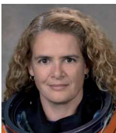
Julie Payette Déléguée scientifique du Québec aux États-Unis Bureau du Québec à Washington