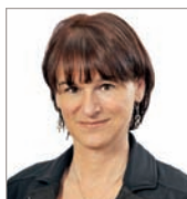
Christine Labelle Technologies 20-20 inc.