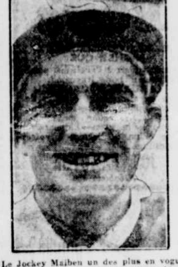
Le Jockey Maiben un des plus en vogue actuellement. On prédit qu'il va bientôt éclipser Earl Sande.