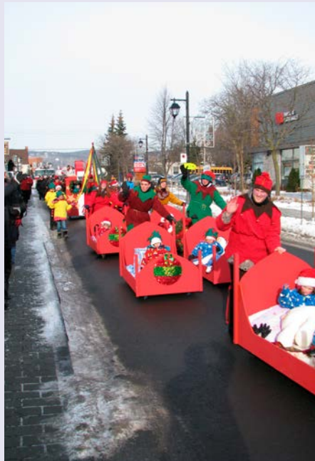
En 2013, les lutins poussent les petits lits colorés.