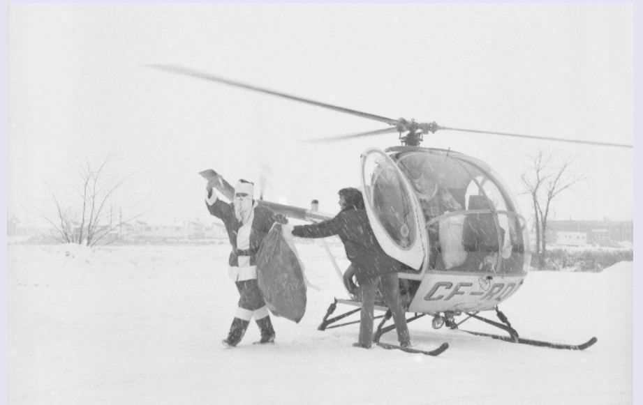
En décembre 1972, l'arrivée du père Noël en hélicoptère, dans le stationnement du marché IGA Lambert, sur la montée Robert.

En 1987, le Club optimiste, en collaboration avec le restaurateur Gregory Tsalamandris, invite les enfants et leurs parents à prendre le petit-déjeuner avec le père Noël au restaurant Saint-Basile, situé rue Savaria. Cette initiative devient une tradition qui se poursuit pendant vingt ans, puis occasionnellement jusqu'en 2010. Jacques Bussière, organisateur de l'activité, commente : « Certaines années, nous servions 800 repas, de 7 h 30 à midi. Cent pour cent des