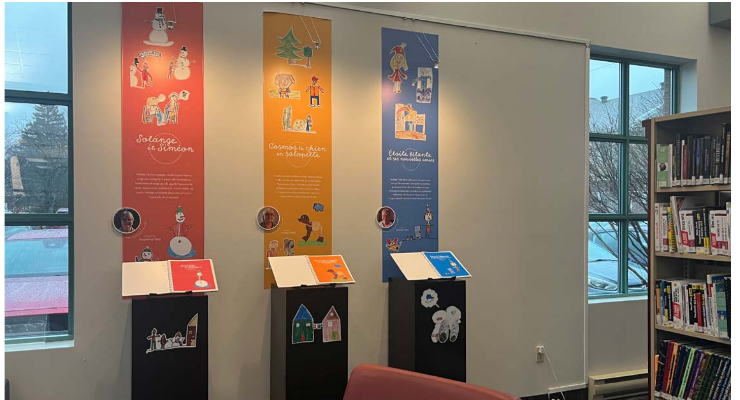
Le livre Mes mots, tes images est exposé jusqu'au 15 janvier prochain.

Les élèves devaient, à la suite de cette rencontre, dessiner des moments de l'histoire. « Ce projet était en lien avec les stratégies de lecture que l'on enseigne aux élèves. On leur dit de se créer des images dans leur tête lorsqu'ils lisent », mentionne Mme Simard.