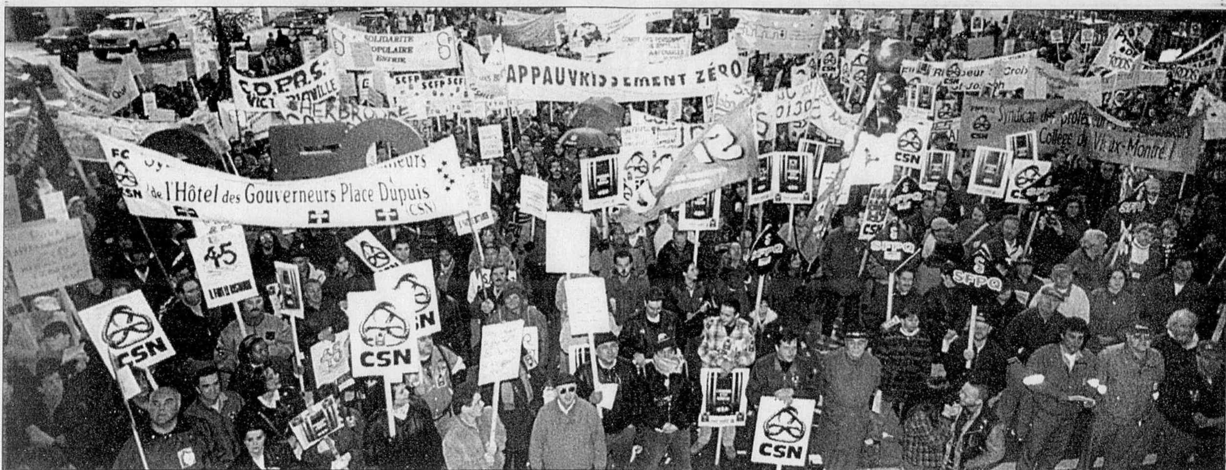
Environ 5000 manifestants se sont massés en début de soirée boulevard René-Lévesque, devant l'hôtel Sheraton où se déroule le sommet.