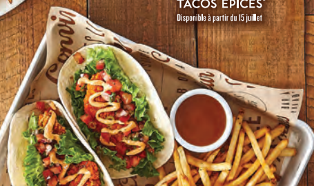
TACOS ÉPICÉS* Disponible à partir du 15 juillet