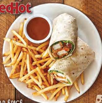
WRAP ÉPICÉ Disponible à partir du 25 juillet