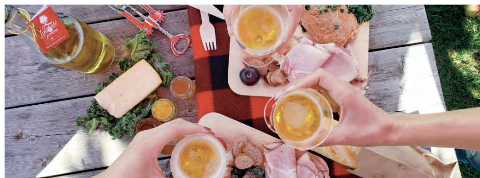
Les pique-niques épicuriens du domaine Labonté de la pomme : tout simplement irrésistibles!

La boutique du terroir vaut le détour. Plus