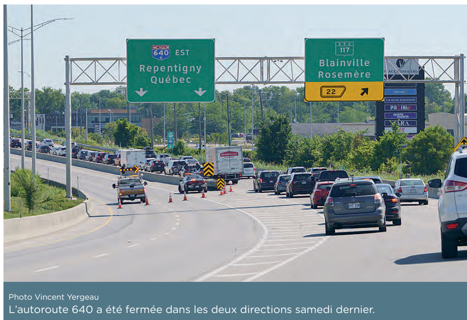
L'autoroute 640 a été fermée dans les deux directions samedi dernier.

Les pompiers de la Caserne Sainte-Thérèse ainsi que le Service incendie de la Ville de Blainville ont travaillé conjointement avec les intervenants d'Énergir, obstruant la fuite près de six heures plus tard. Hydro-Québec est également intervenu pour remédier aux coupures de courant préventives qui ont été effectuées.