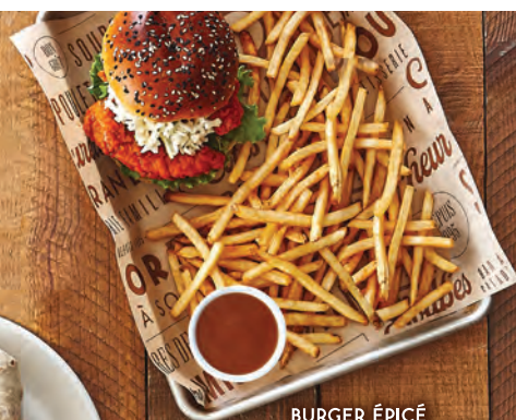
BURGER ÉPICÉ Disponible à partir du 4 juillet