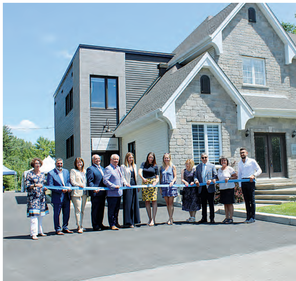
Plusieurs partenaires étaient présents pour la traditionnelle coupe du ruban.

Uniquement l'an dernier, Autisme Laurentides a offert plus de 25 000 heures de répit. Et ce nombre ne fera qu'augmenter sachant que les taux de prévalence de l'autisme au Québec étaient de 1 enfant sur 250 il y a 25 ans et qu'il est passé à 1 enfant sur 64 aujourd'hui. Pour la région des Laurentides, cette statistique représente près de 600 nouveaux diagnostics par année.