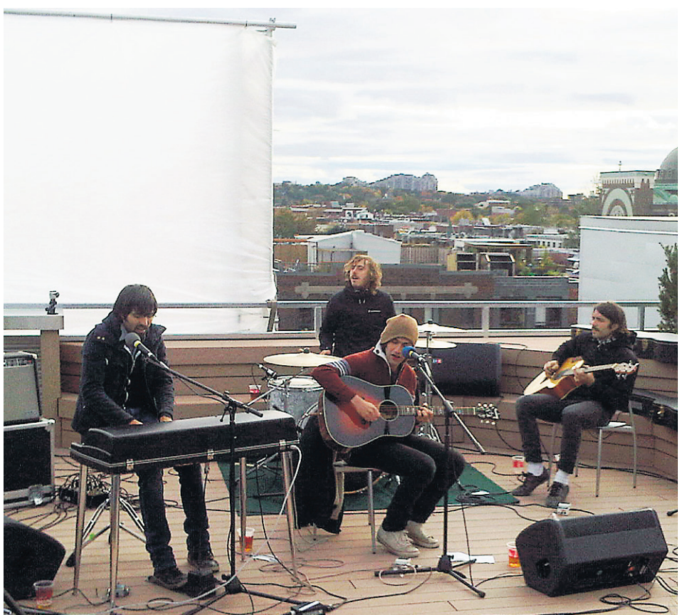
Malajube sur la terrasse d'Ubisoft.

Avec cette réputation de guitare héroïne qui la précède, Marnie Stern devrait peut-être réfléchir aux fausses notes récurrentes de son chant... et resserrer son jeu lorsqu'elle se présente devant des fans de guitare qui viennent à sa rencontre. Étrangement, cette performance m'a semblé inférieure à ce que j'ai entendu sur ses albums ainsi qu'à certaines performances live mises en ligne sur la Toile. Dommage.