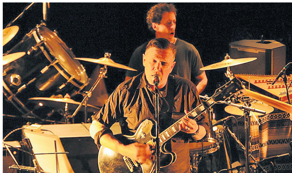
Le groupe américain Swans mené par Michael Gira.