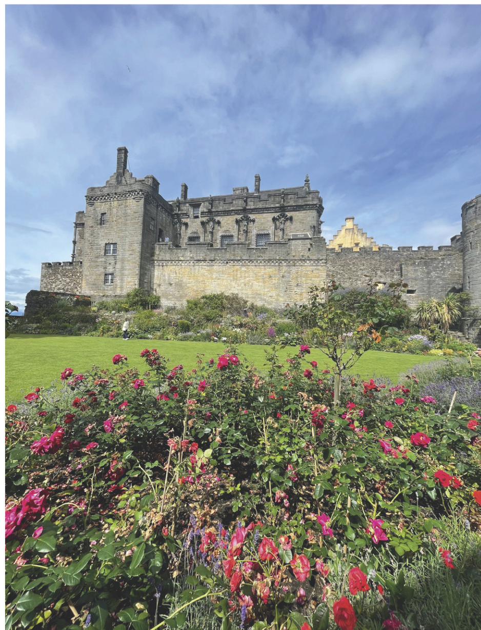
Un château écossais.

De retour au Québec depuis le 15 août, Thessalie se concentrera sur la dernière tranche de la Coupe Québec à Coteau-du-Lac, avant de prendre la direction de l'Alberta avec 25 coureurs de l'équipe du Québec à la fin août pour la Coupe Canada. Au retour de l'équipe au Québec, la Latuquoise se rendra à Louisville dans le Kentucky. « Les courses aux États-Unis sont différentes de celles du Québec, j'ai vraiment hâte. Je vais avoir vu beaucoup de pays cette année avec mes différentes compétitions. »