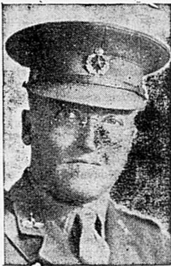
Le major J.-E. PICARD, E.D., du régiment de Montmagny, qui vient d'être nommé Commandant de l'École No 5 d'Enseignement Technique de l'Armée à Rimouski, en remplacement du major G.-B. Fels, qui est rendu au Collège Militaire Royal de Kingston pour suivre le 2e cours d'Etat-Major dans le domaine des affaires civiles pour l'occupation des régions envahies à l'ennemi.