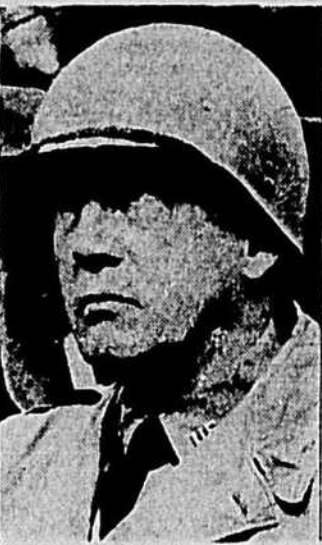
Le major-général Georges S. Patton, fils, commande les Américains qui débarquent sur certains points de la côte occidentale de l'Afrique. On ne spécifie pas quels sont ces points.

La gravité de la situation en Afrique septentrionale française commence à avoir des répercussions en France continentale.