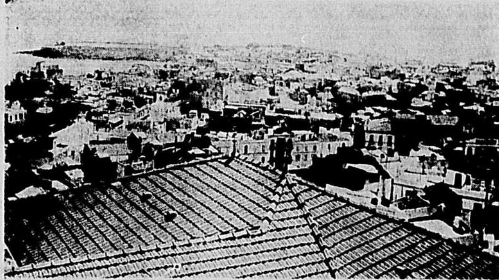
Alger, capitale de l'Algérie, l'une des trois provinces françaises de l'Afrique française du nord, a capitulé aux mains des Américains qui y débarquèrent samedi sous les ordres du lieutenant-général Dwight D. Eisenhower, commandant américain.

Alger s'est rendu aux mains des Américains