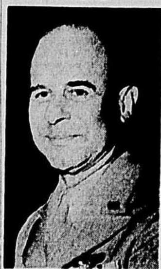
Le brigadier-général James H. Doolittle, héros du fameux raid américain sur Tokio, commande les forces aériennes lancées dans la conquête de l'Afrique du nord française.