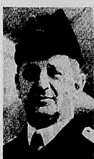
Le contre-amiral H.-K. Hewitt commandant de toutes les forces navales américaines affectées aux vastes opérations en cours au large de l'Afrique du nord française, depuis samedi.