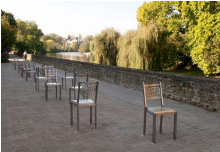
Alchimie des ailleurs © Michel Goulet

Né à Asbestos, Michel Goulet est reconnu pour son importante contribution à l'art public. Il a créé plus d'une quarantaine d'oeuvres permanentes qui se trouvent, entre autres, au Central Park de New York et sur la Place Roy à Montréal. Son oeuvre Voix/Voies , présentée pour la première fois au Havre lors de la biennale d'art contemporain de 2006, fait désormais partie de la collection permanente de la ville du Havre et se trouve dans les jardins de l'Hôtel Dubocage de Bléville, au coeur d'un des plus anciens quartiers de la ville.