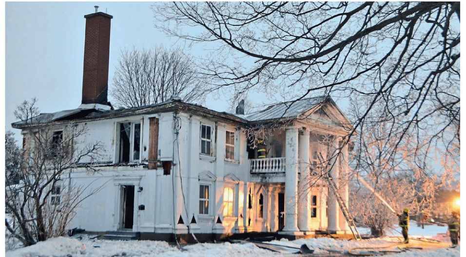
Le Manoir Taschereau avait été touché par le feu il y a deux ans.

Jasmin Belle-Isle avait comparu une première fois le 6 janvier dernier sous deux chefs d'accusation, dont une accusation d'incendie criminel sur ses biens. Sa cause doit revenir en cour le 25 avril prochain.