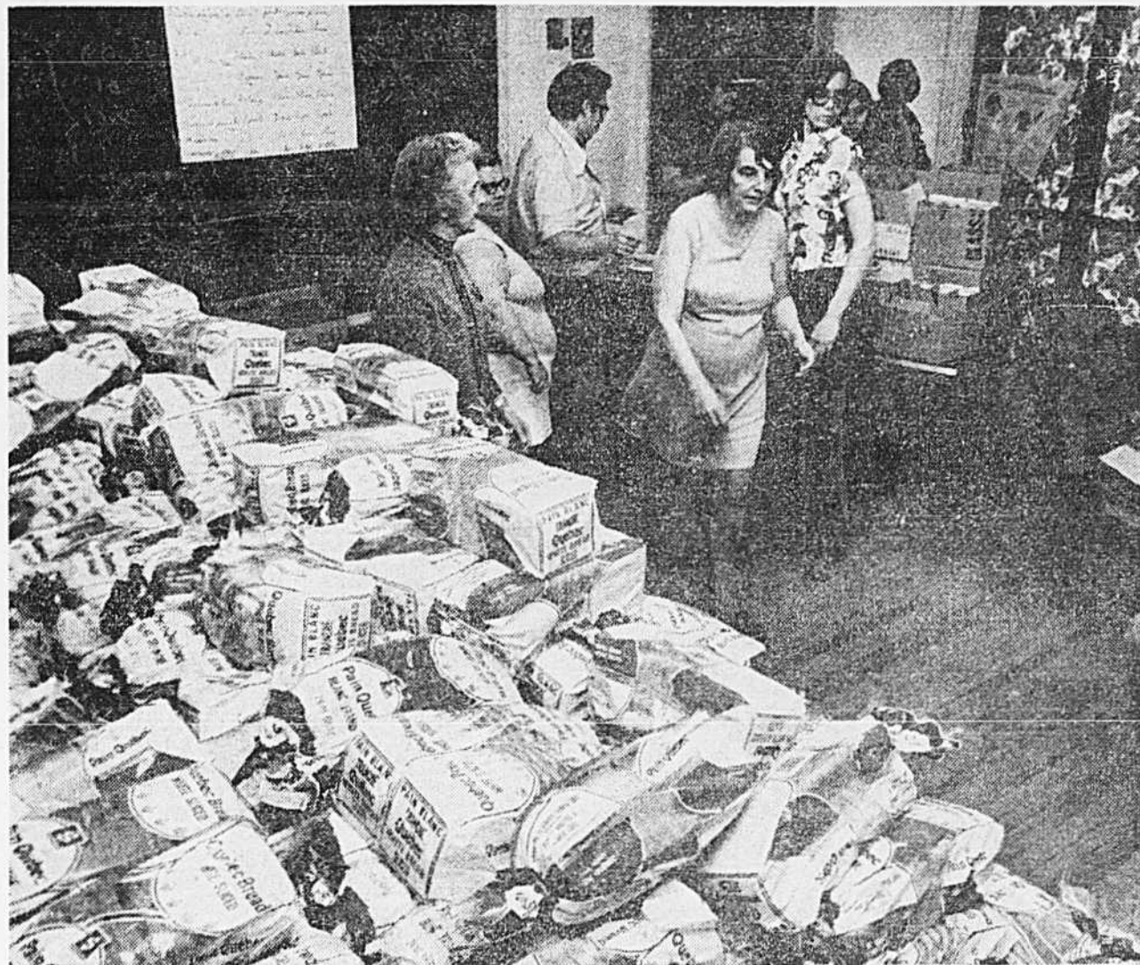
Non. Cette photo n'a pas été prise dans une boulangerie. Mais dans le sous-sol de l'église Saint-Mathias où l'opération dépannage d'urgence démarrait, hier après-midi. Déjà la liste du comité comptait au moins 250 familles qui n'avaient plus rien à manger parce qu'elles n'avaient pas reçu leur chèque d'allocations familiales.

A Québec et à Montréal, les chèques destinés à ces personnes seront disponibles dans des centres dont les adresses seront annoncées dans les quotidiens de lundi prochain. Ces centres seront ouverts de 8 heures 30 à 20 heures 30 à compter de lundi jusqu'au 1 er mai inclusivement.