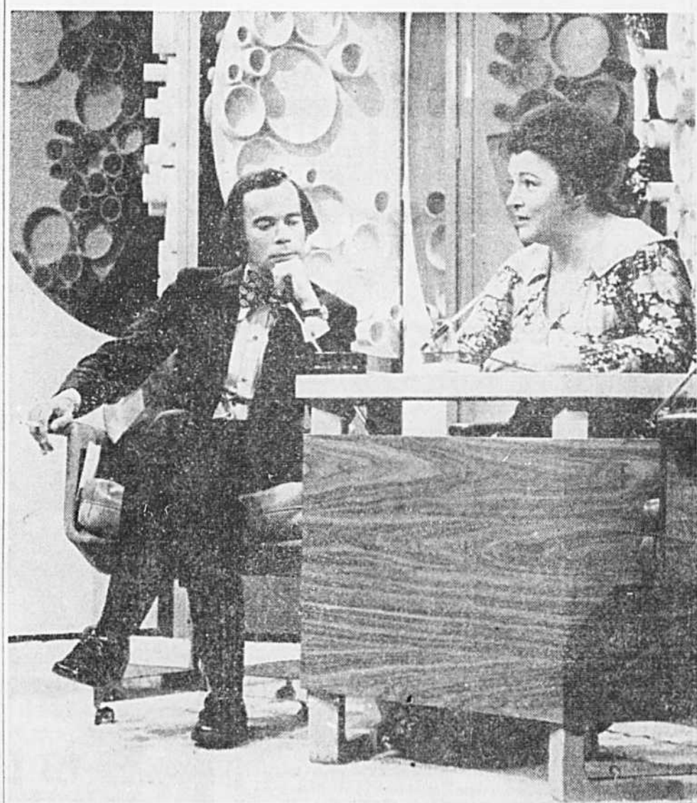
On regarde Radio-Canada