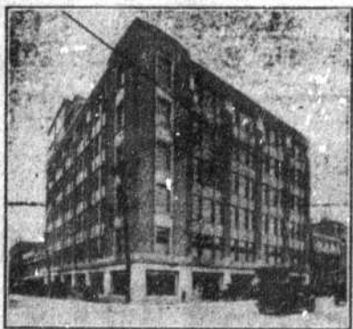
Le nouvel édifice Dupuis Frères, érigé par Archambault & Leclair. Ingénieur: Arth. Surveyer. Architecte: H. S. Labelle.