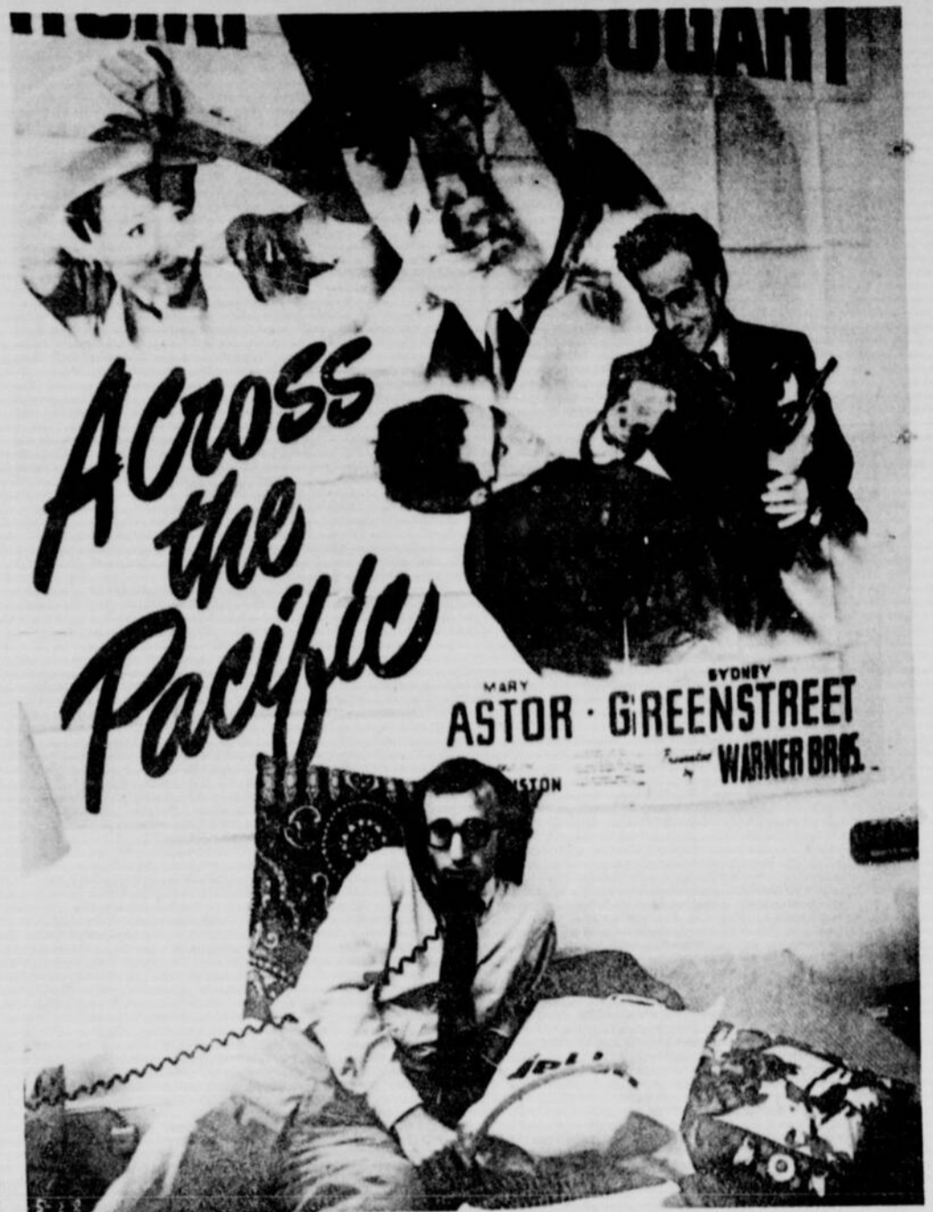
Le cinéma York présente en troisième semaine le film américain "Play It Again, Sam" qu'a réalisé Herbert Ross en collaboration avec Woody Allen.

Comédie de Peter Bogdanovich. Avec Ryan O'Neal et Barbra Streisand. Cinéma Westmount. Pour tous. Une sorte d'imbroglio fort amusant occasionné par la présence quasi fortuite, dans un hôtel où se déroule un congrès de musiciens, de quatre valises qui se promènent continuellement d'un propriétaire à un autre... Et au milieu de cette hilarante confusion, vont se côtoyer, froidement au début, amoureusement par la suite, un jeune professeur de musique (Ryan O'Neal) et une étudiante (Barbra Streisand) qui arrive juste au bon moment pour sauver ce dernier d'un mariage qu'il ne désire vraiment pas contracter... Une heureuse fertilité de gags et d'humour.