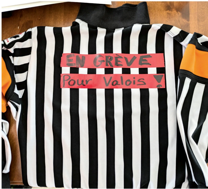
Les arbitres venus manifester leur support à l'ancien arbitre-en-chef, Daniel Valois, étaient bien visibles vendredi dernier et ont su attirer l'attention sur leur mécontentement.