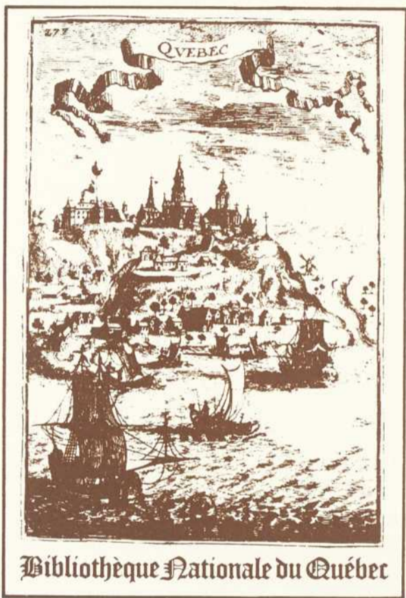
Bibliothèque Nationale du Québec