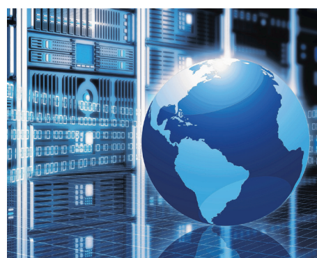
Le TCTIC compte près de 60 membres et partenaires de partout en Gaspésie-Îles-de-la-Madeleine.

Après son adoption en 2012 (par la CRÉ), le Plan numérique territorial pour le développement des technologies de l'information (TI) devient ensuite la Stratégie numérique GÎM, avant d'être mis en veilleuse par l'abolition de l'organisation en 2014. Il faudra attendre en juin dernier avant que la Table des préfets des MRC identifie le TCTIC comme nouveau porteur du dossier.