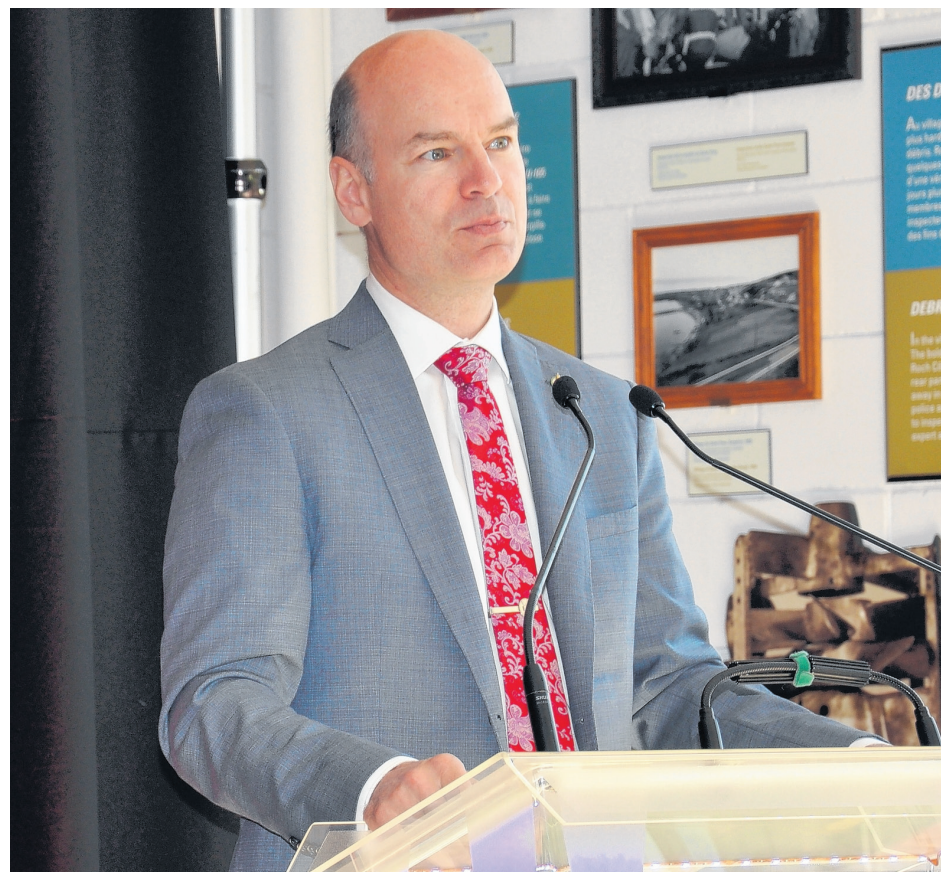
Le député Rémi Massé invite les organismes de la région à soumettre un projet dans le cadre du nouveau programme Brancher pour innover.

Les formulaires de demande de financement seront disponibles, en ligne, à partir du 16 janvier. Tous les détails du programme sont également disponibles sur le site Web du ministère de l'Innovation, des Sciences et du Développement économique.