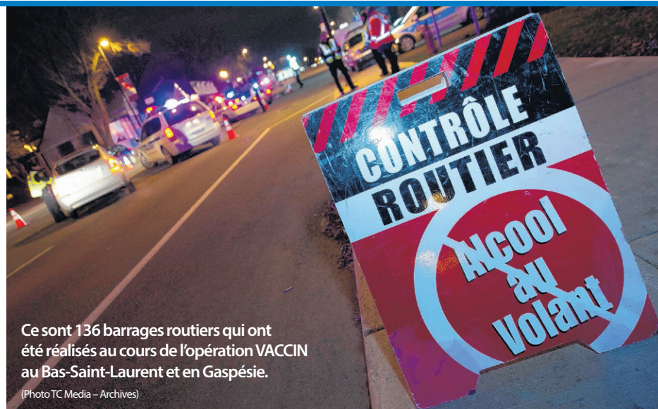
Ce sont 136 barrages routiers qui ont été réalisés au cours de l'opération VACCIN au Bas-Saint-Laurent et en Gaspésie.

À l'échelle provinciale, plus de 2395 opérations policières ont été déployées dans le cadre de cette opération, et plus de 1715 personnes ont été arrêtées pour capacité de conduite affaiblie par l'alcool ou la drogue. Ce nombre d'arrestations représente une hausse de plus 20 % comparativement à l'an dernier.