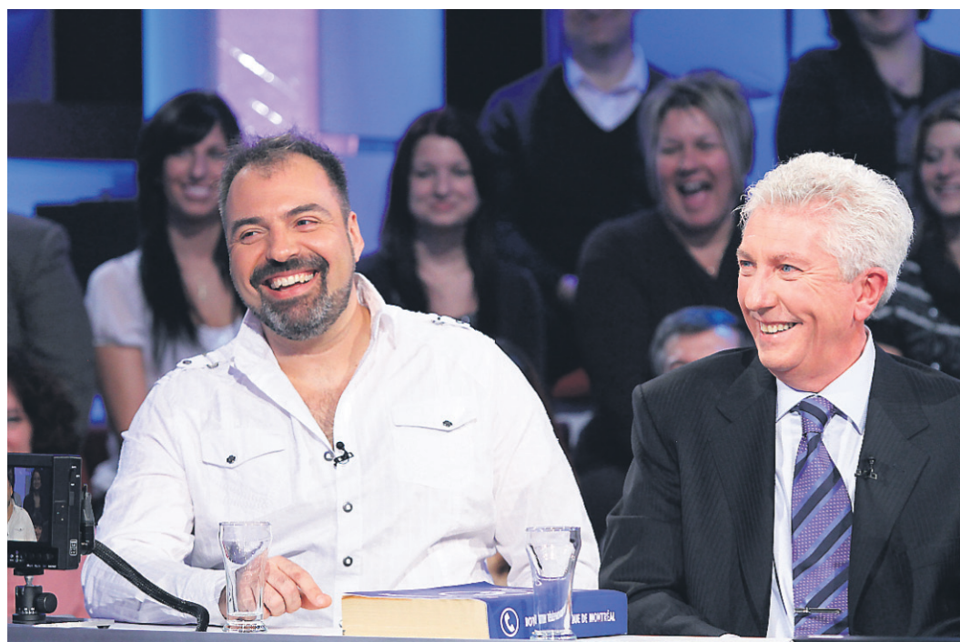
Tout le monde en parle - spéciale de fin d'année. Jean-François Mercier et Gilles Duceppe.