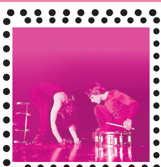
HIT AND FALL