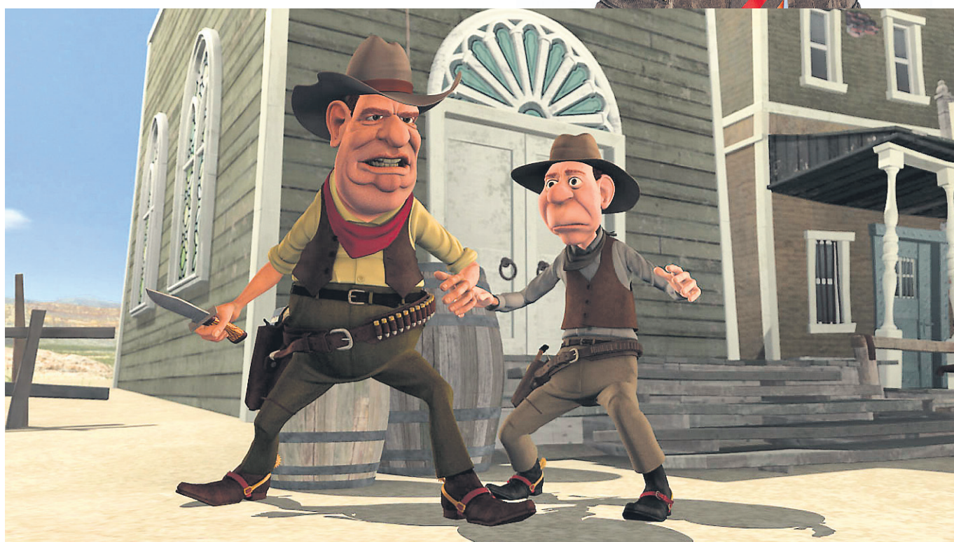
Et Dieu créa Laflaque: Western.