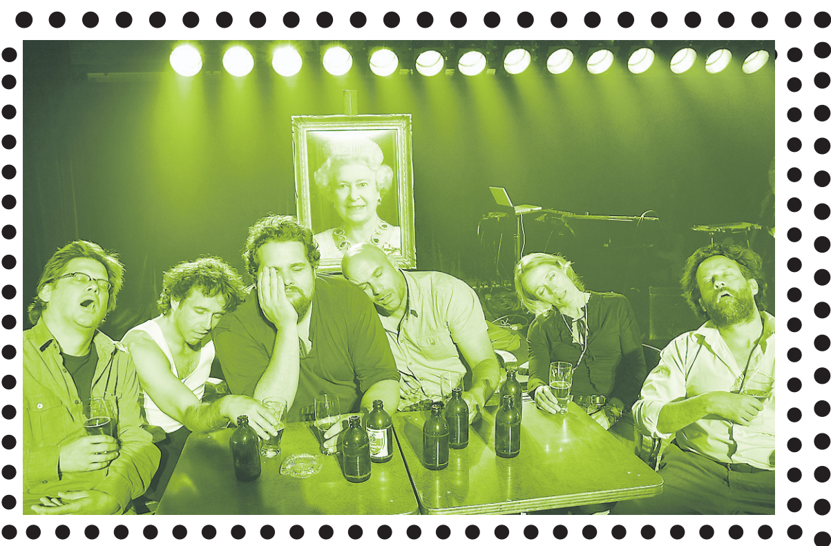
TOUT ÇA M'ASSASSINE