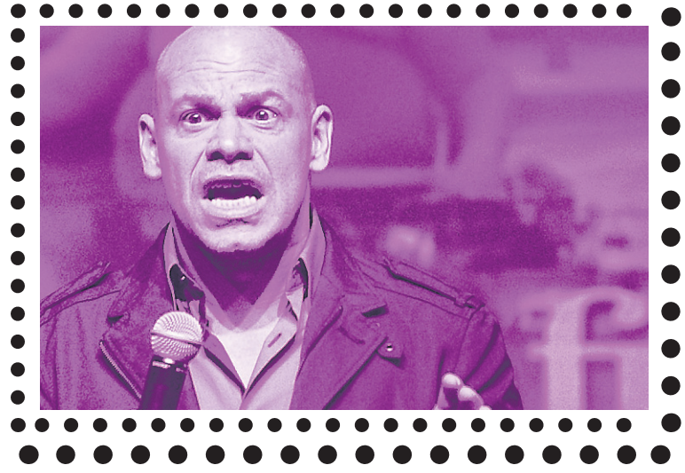
MAXIM MARTIN