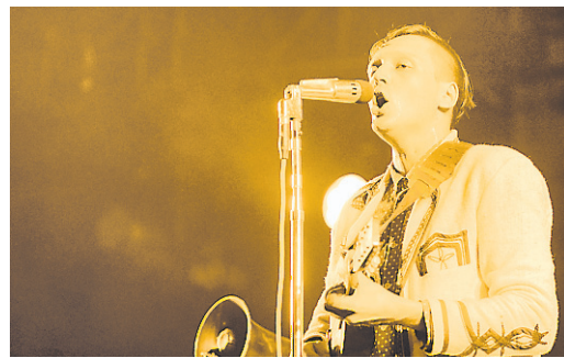
ARCADE FIRE