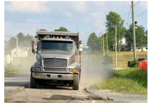
Travaux rang 3 Sud