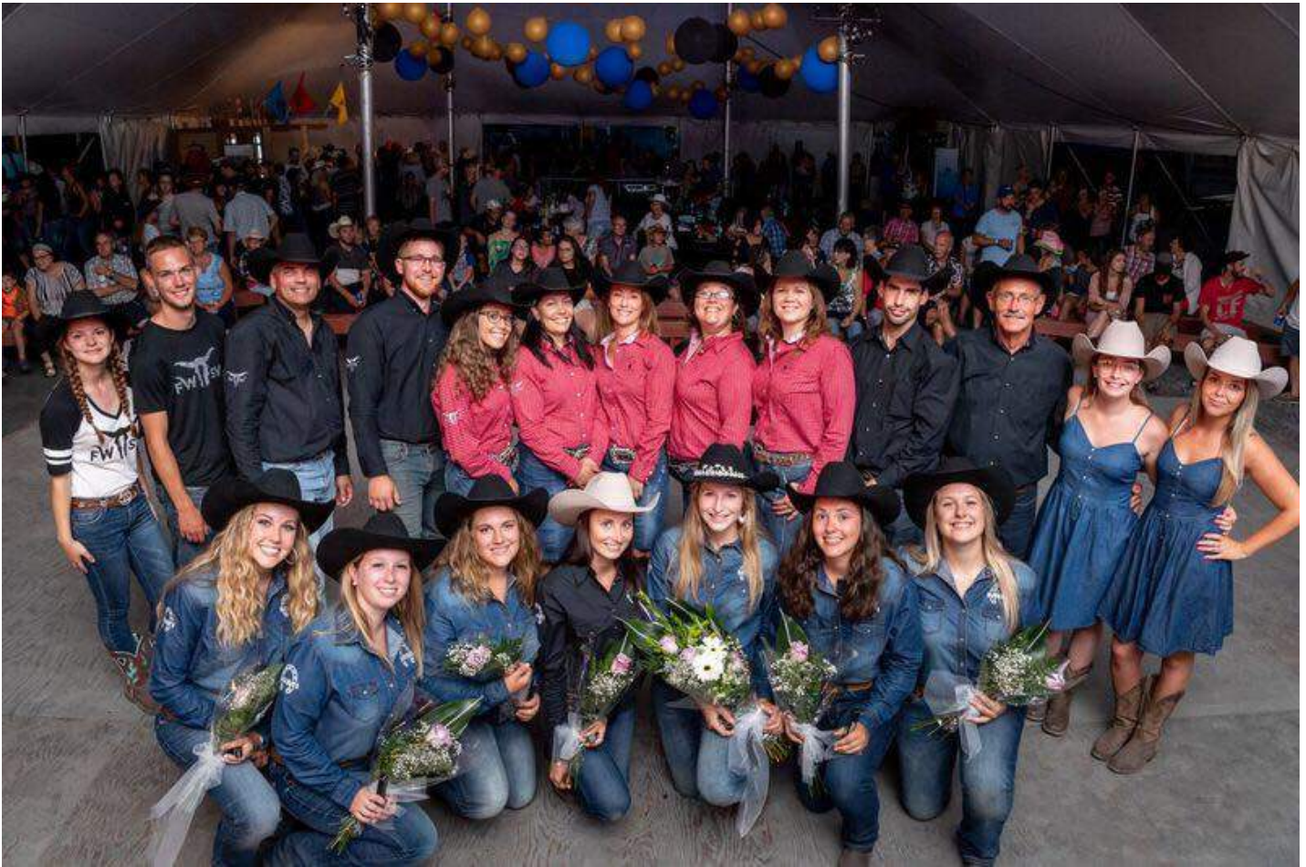
29 juillet : Félicitations au comité organisateur des Festivités Western et à ceux qui ont travaillé de près ou de loin à cet événement d'envergure. Ils ont su faire de cette 40 e édition un véritable succès !