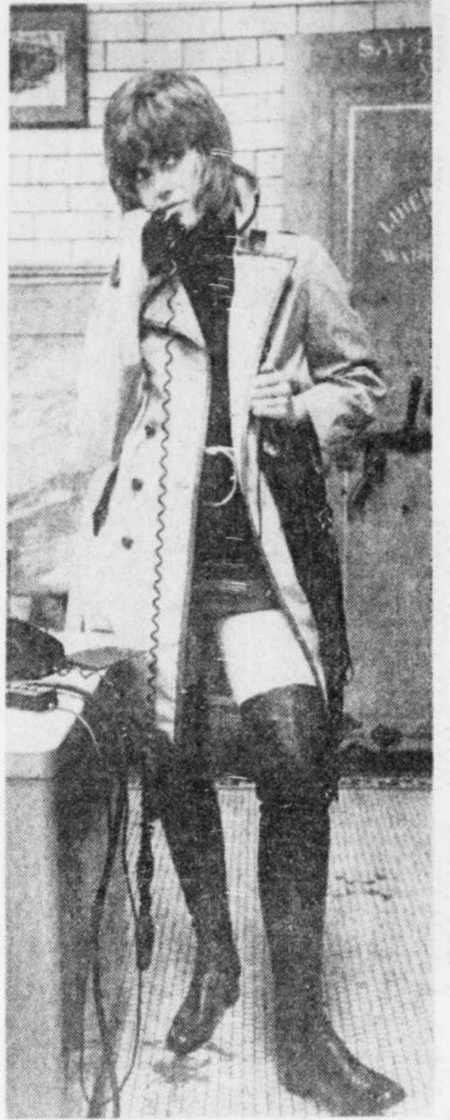
Jane Fonda dans "Kluge".

L'auteur du scénario du film de Martin Scorsese, qui doit prendre l'écran bientôt, publie un roman tiré de son propre texte, comme cela est devenu une pratique courante dans le monde malade du cinéma à l'heure actuelle. Celui-ci fait montre de détails différents du film qui lui donnent un certain intérêt.