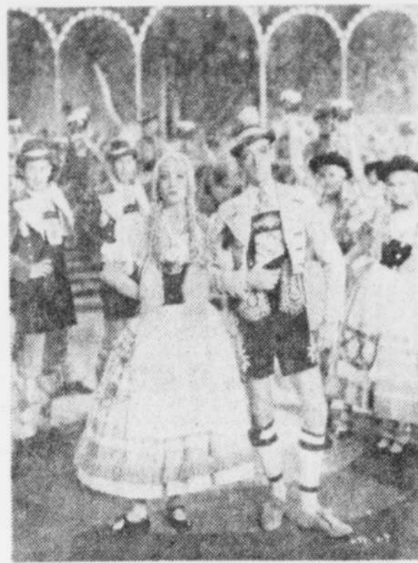
Joan Crawford et Fred Astaire dans "Dancing Lady".

Magazine pour le grand public, "Première"