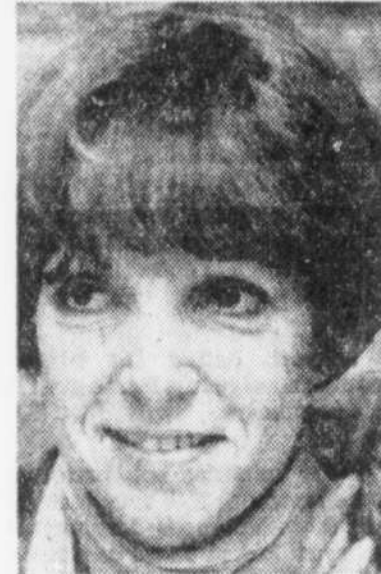
Monique Leyrac au Théâtre de l'île.

MONIQUE LEYRAC chante Félix Leclerc, au Théâtre de l'île à Saint-Pierre d'Orléans. Du 25 juin au 3 juillet à 21h. (Samedi à 20h et 22h).